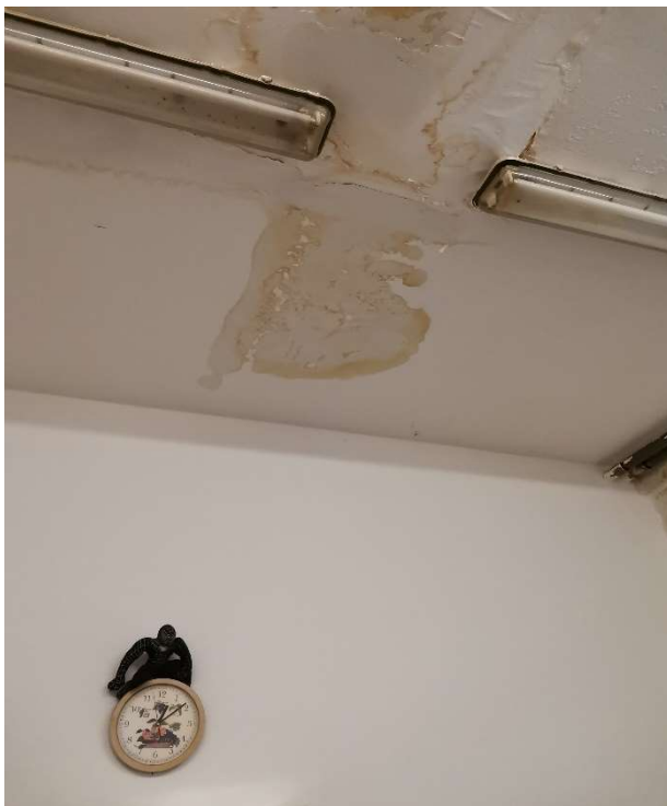
Obr. č. 9