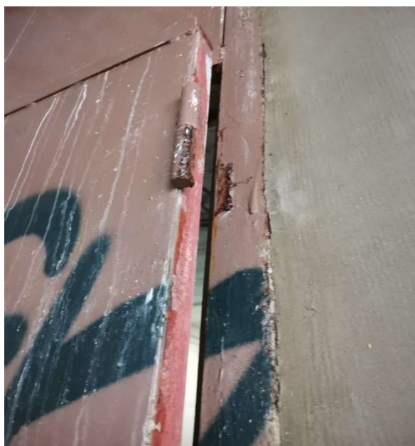
Obr. č. 15