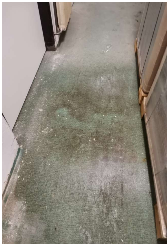
Obr. č. 13