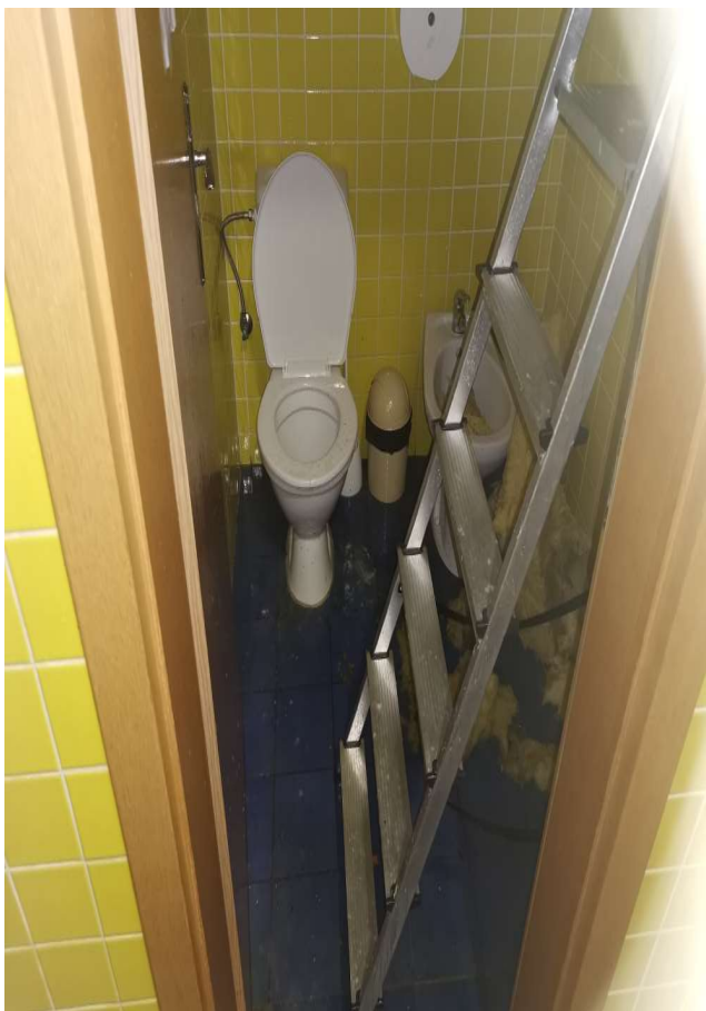
Obr. č. 17