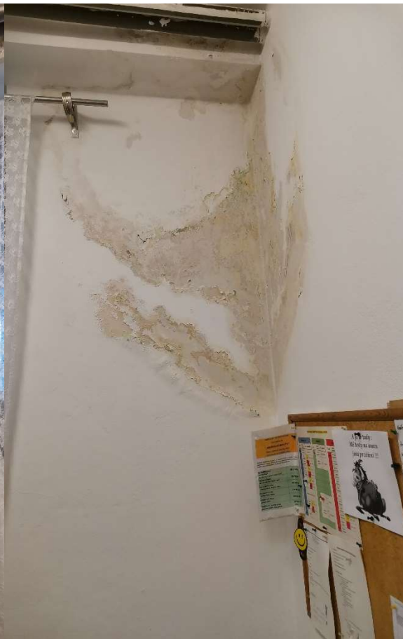
Obr. č. 8