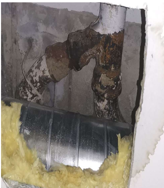
Obr. č. 19