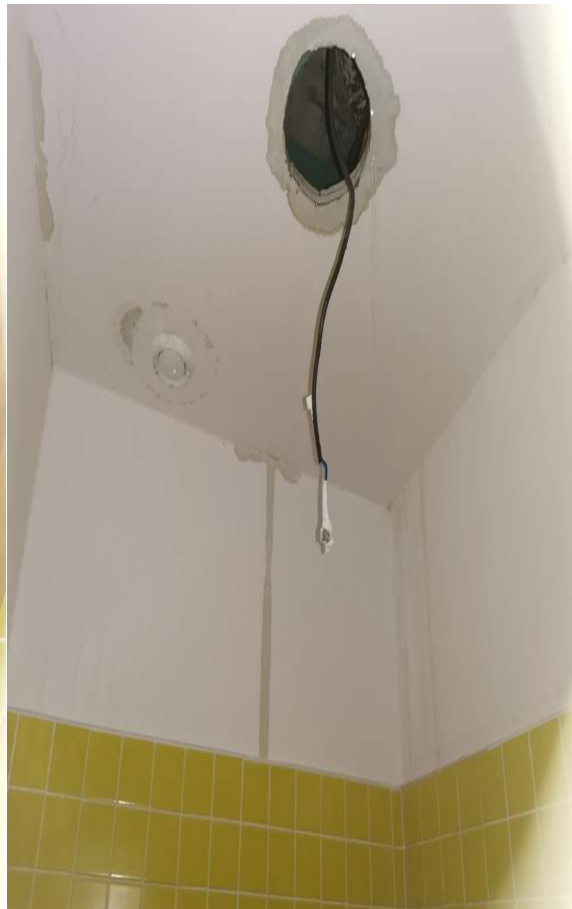
Obr. č. 18