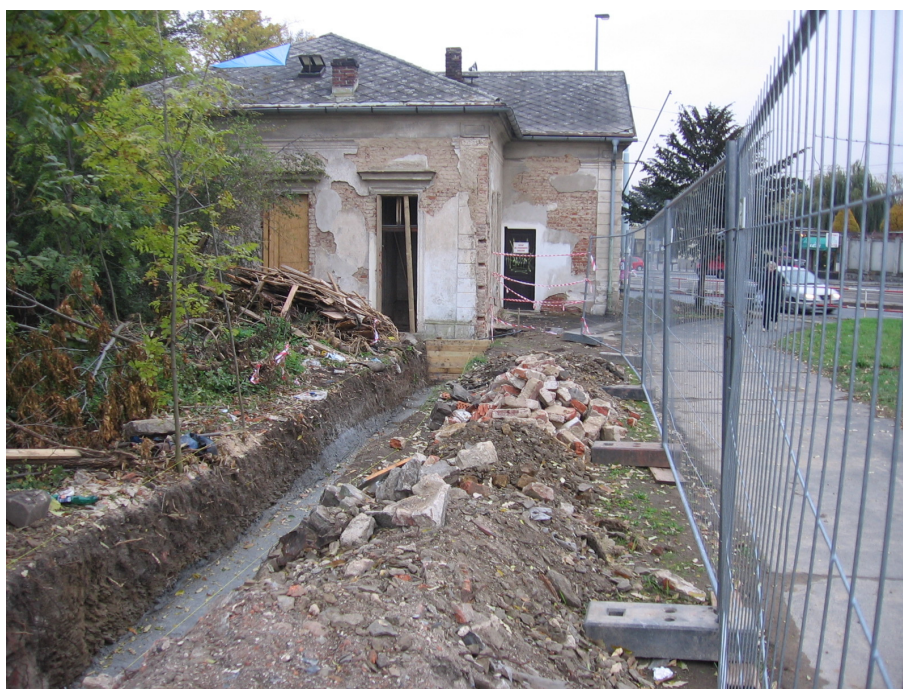
Oprava plotu hřbitova

Stavbaři nejprve začali s opravou ohradní zdi, která má zabezpečit areál hřbitova, aby sem nemohli bezdomovci. Zbytky staré zdi podél Počernické ulice byly strženy a začalo se pracovat na nové. Ohradní zeď podél Vinohradské má být posunuta tak, aby bylo možné dostavět chodník pro pěší v části, která vede přímo vedle silnice. V dalších letech se má opravovat hřbitovní domek, hřbitovní kaple, oprav se dočkají i hrobky a památkově chráněné hroby. Na hřbitově se objeví osvětlení, upravena bude veškerá zeleň. Podle plánů by zde v budoucnu měl vzniknout urnový háj a rozptylová loučka.