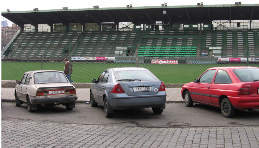
Stadion Bohemky po „návštěvě“ orkánu Kyrill