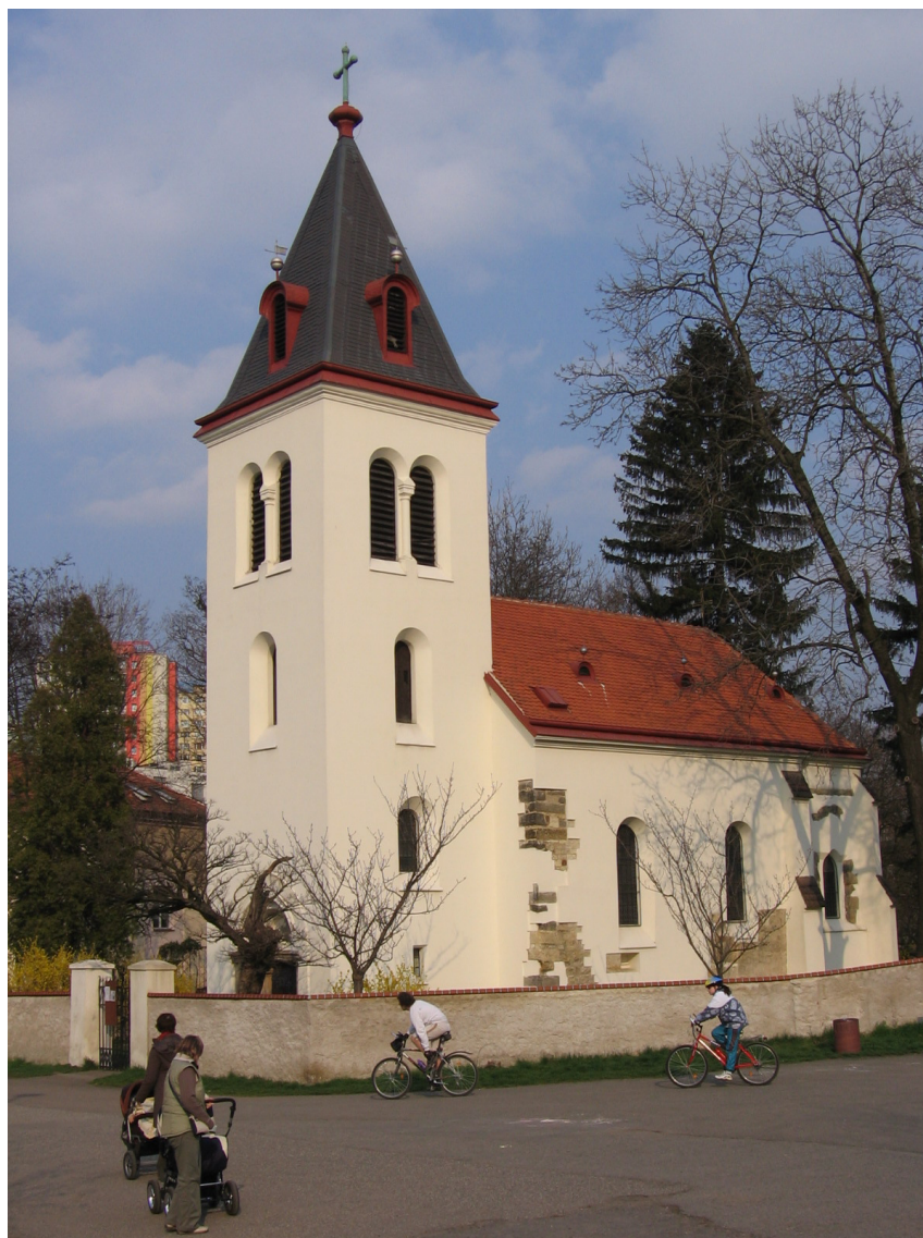
Kostel Narození Panny Marie v Záběhlicích

Nelze zapomenout ani na to, že se mše svaté konají v Domově seniorů v Praze 10 – Záběhlicích, Sněženská 2973/8 vždy poslední úterý v měsíci od 15:15 hodin.