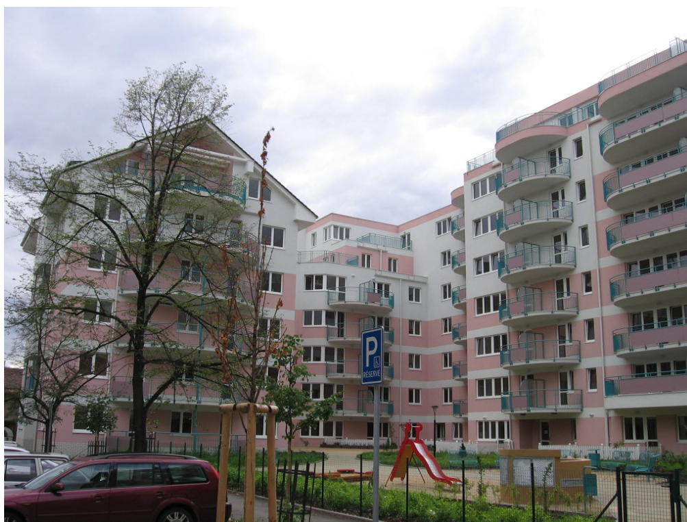
Obytný soubor Gutovka