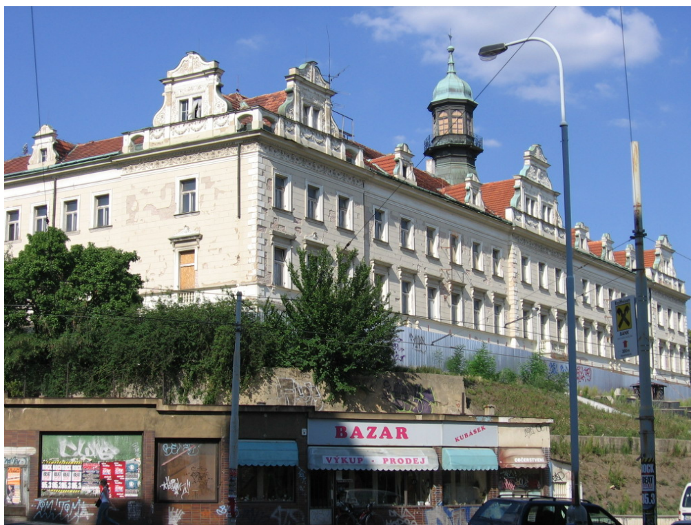
Rangherka a obchůdky pod ní

Rekonstrukce a přestavba se odhaduje na 322 milionů korun. Na celkových nákladech rekonstrukce se bude Praha 10 spolupodílet částkou 199 milionů, zbylou částku poskytne vítězné konsorcium firem. Soukromý investor, kterého desátá městská část hledala v celé Evropě, poskytne 126 milionů korun. Po skončení oprav bude mít Vršovický zámeček v nájmu po dobu třiceti let a bude za něj platit radnici nájemné. Vršovický zámeček samozřejmě zůstane v majetku Prahy 10, ale ta nebude muset zajišťovat náklady na údržbu ze svých peněz. Rekonstrukce by měla být hotova od zahájení do dvou let. Podle plánů by měla být dokončena v říjnu 2008.