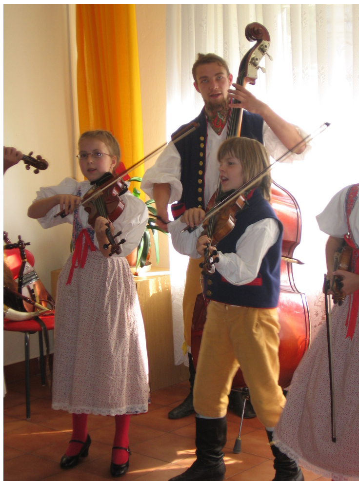
Dětská lidová muzika Notičky na Mezinárodním dni seniorů

V roce 1982 byl francouzským ministerstvem kultury Jacque Langem vyhlášen na den letního slunovratu Svátek hudby na podporu aktivního provozování hudby. Od té doby se tato myšlenka šíří po Evropě a amatérští i profesionální muzikanti přijali 21. červen za svůj Svátek hudby. K myšlence se připojila i Praha 10 každoročním koncertem v některém zařízení pro seniory.