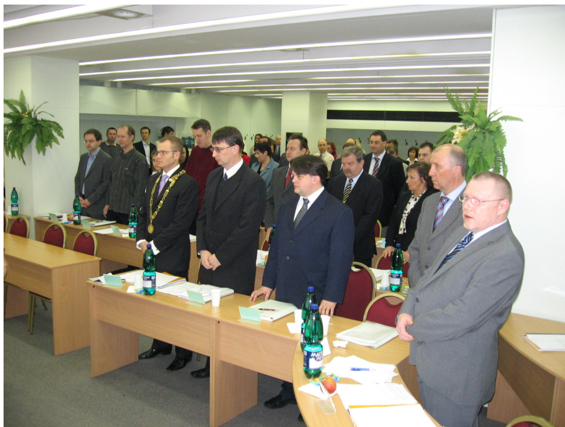
Ustavující zasedání Zastupitelstva městské části Praha 10

Jednání zastupitelstva skončilo v 12:14.