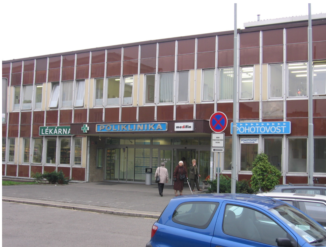
Pohotovost v Malešicích

Na kliniku vinohradské nemocnice, kde léčí popáleniny, každý rok ulehnu tři stovky dětí. Některé zde stráví i několik měsíců života.