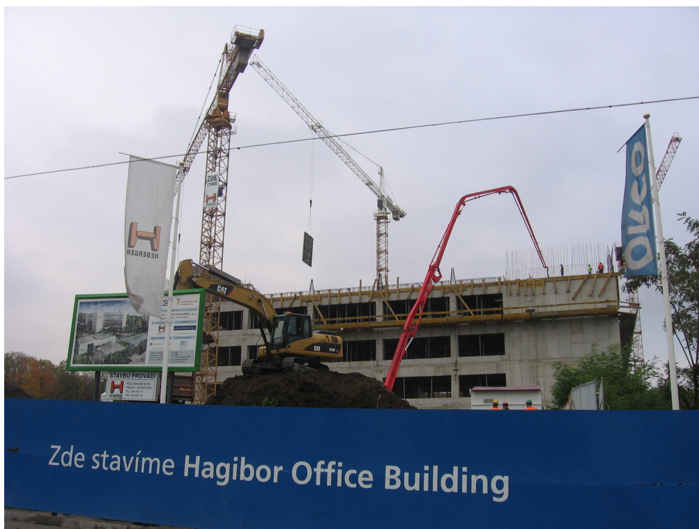
Hagibor Office Building