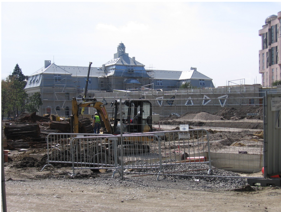
Výstavba Domova sociální péče Hagibor

Některé z nich byly již dokončeny v roce 2006, jiné nebyly hotové ani ke konci roku 2007. O těch stavbách, které se v roce 2007 stavěly, se zmiňuji v kapitole Výstavba a bydlení.