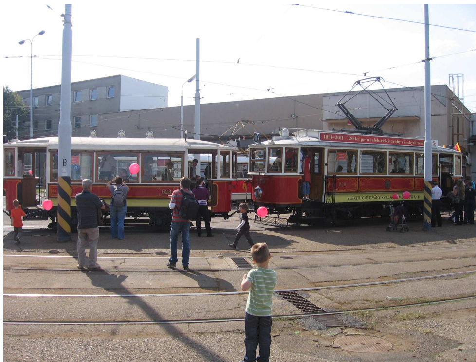
Den otevřených dveří v areálu Depo Hostivař

Díky krásnému počasí zavítalo do areálu více jak deset tisíc spokojených návštěvníků. Exkurze do prostor běžně veřejnosti uzavřených nadchla všechny věkové kategorie v depu, garážích i vozovně. Vstup byl zdarma.