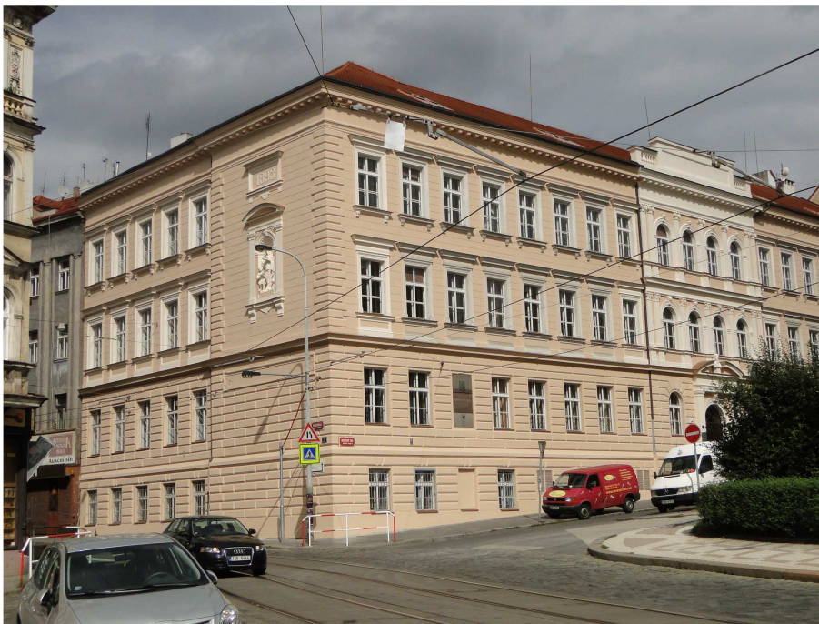
Obchodní akademie Heroldovy sady 1

Studenti školy dosahují vynikajících výsledků na republikové úrovni v ekonomických soutěžích, obchodní akademie je nejlepší na světě ve zpracování textu , studenti i vyučující jsou několikanásobnými mistry světa v psaní na PC. Mimo již klasických nabídek pro studenty (veletrh FIF, jazykové a výměnné zájezdy, sportovní kurzy, maturitní plesy, klub mladého diváka) se nové akce a služby stávají rovněž běžnými – projektový den, noc na škole, úvodní seznamovací kurz, psaní maturitních zkoušek na PC, zavedení elektronických výkazů nebo přípravné kurzy na VŠ.