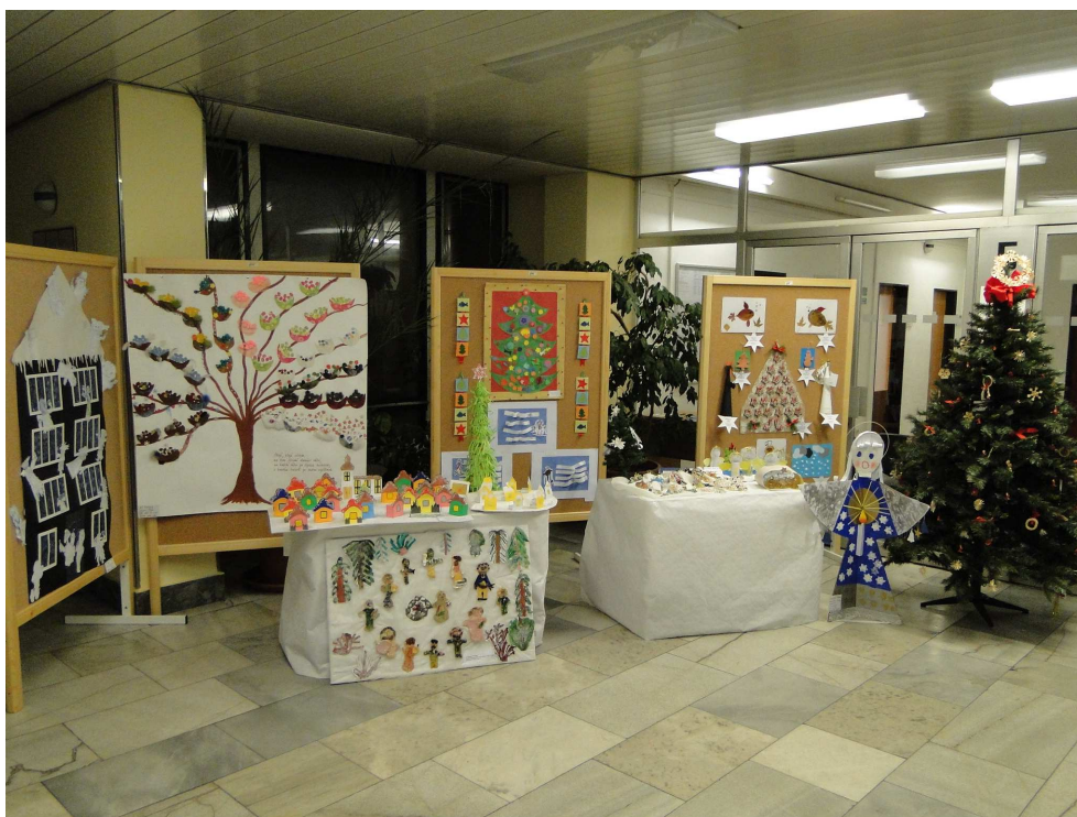
Galerie v 5. patře – výstava „Svět kolem nás a vánoční čas“

Odborná porota hodnotila práce ve třech věkových kategoriích, v každé z kategorií byly posuzovány zvlášť práce jednotlivců a práce kolektivní. Vítězové byly slavnostně vyhlášeni a oceněni v rámci programu na “Vánočních trzích Prahy 10” na Kubánském náměstí.