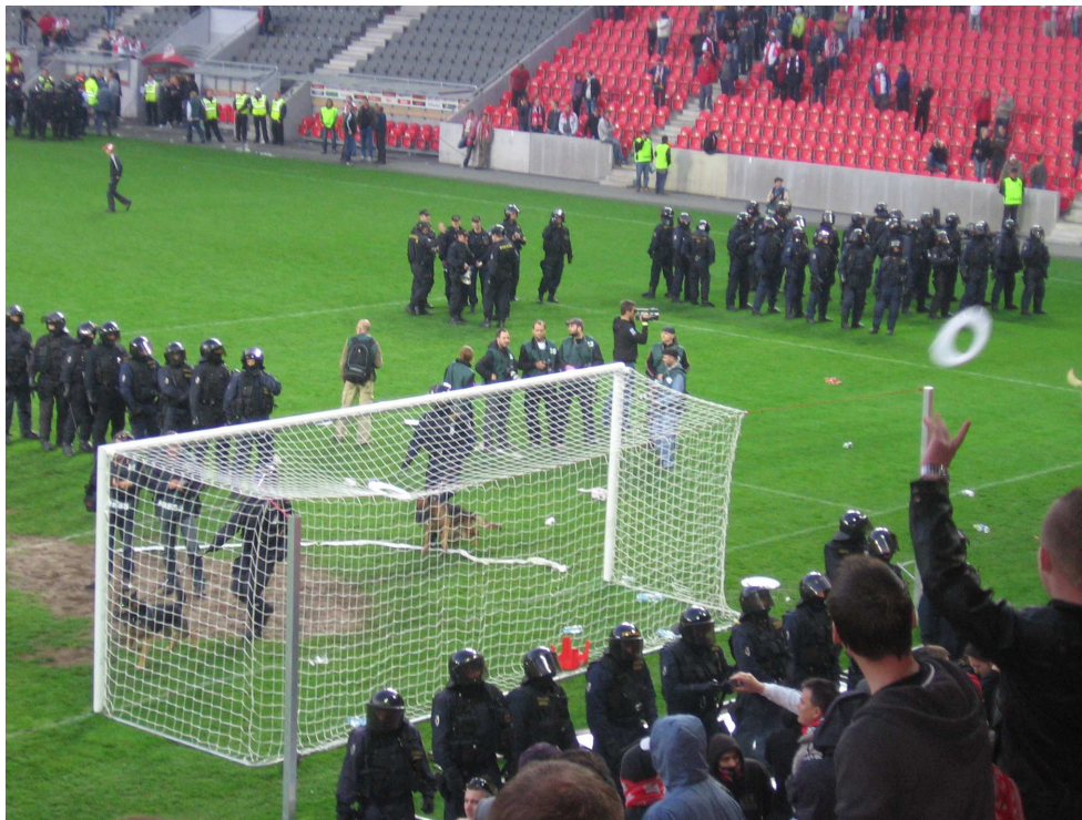
... na konci zasahovala policie

Následoval tvrdý zásah těžkooděnců. Ti vhodili mezi fanoušky strategické rozbušky, které mají ohlušující a lekavý efekt. Během chvíle bylo hřiště prázdné a fanoušci byli zahnáni na tribuny, především na tribunu za bránou. Dorazili policisté se psy a stáli před kotlem Slavie, kde drželi fanoušky v šachu. Policie odvedla prvního zadrženého.