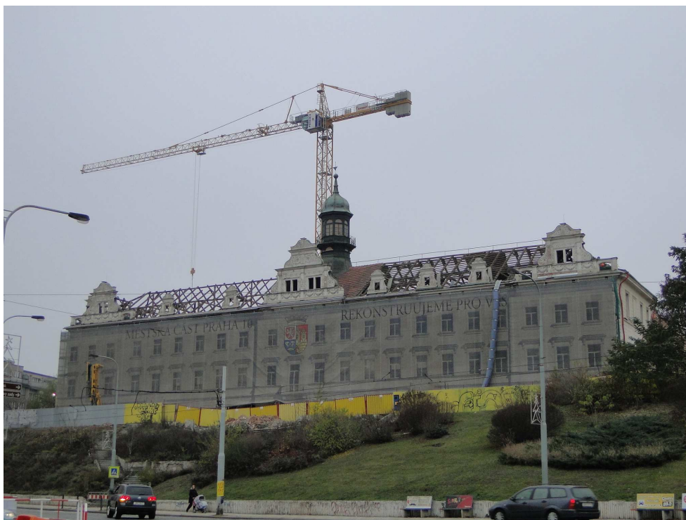
Rangherka v listopadu 2011

V části budovy vznikne nová obřadní síň a opraven bude i zahradní altán. V obou by se pak měly v budoucnu konat svatby. Měly by zde také vzniknout podzemní garáže. Zároveň je v plánu rekonstrukce přilehlého parku. Součástí stavebních úprav bude přeměna zatáčky, kudy vedou tramvajové koleje, a obchodů pod zámečkem i zanedbaného parku ve svahu.