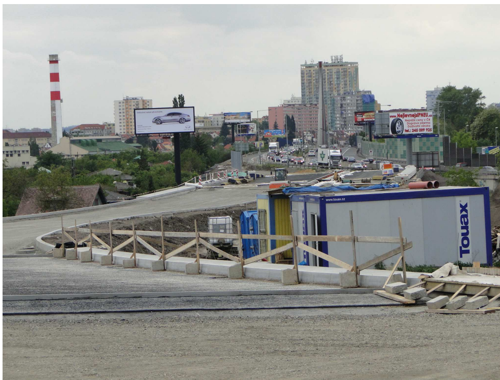
Výstavba nového mostu na Štěrboholské radiále

Do té doby byla linka 193 ukončena v zastávce Náměstí Bratří Syнкů. Tato změna mohla být provedena po dokončení stavebních úprav v oblasti nově zřízené zastávky.