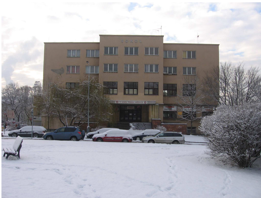
Budova Sokola Vršovice

Medaile z župních přeborů si odnesli i naši nejmenší – předškoláci. Jako družstvo zvítězili v celé Praze a v jednotlivcích získali v župě 2 zlaté medaile.