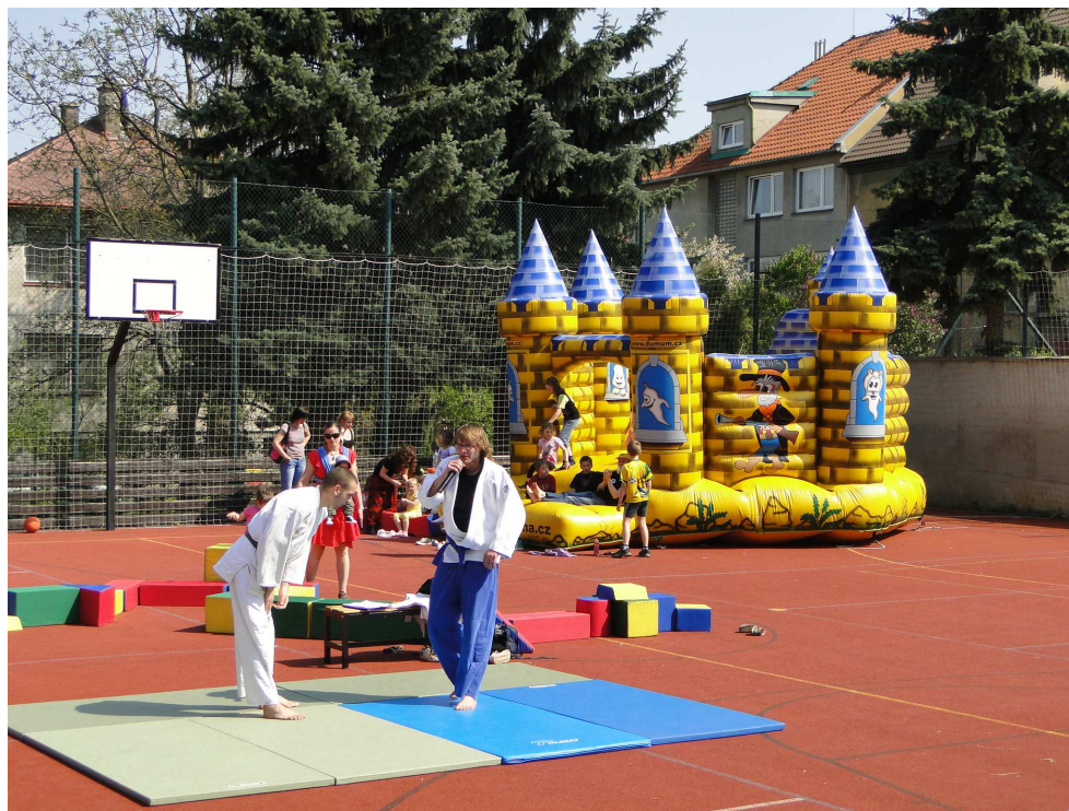
Den Země v Domě UM

vernisáží výstavy obrazů, které namalovaly kolektivy dětí z mateřských škol, speciálních škol a školních družin z Prahy 10. Letošním tématem byla společná tvorba mandal. Připraveny byly hry, malování na obličej a ruce, skákací hrad atd.