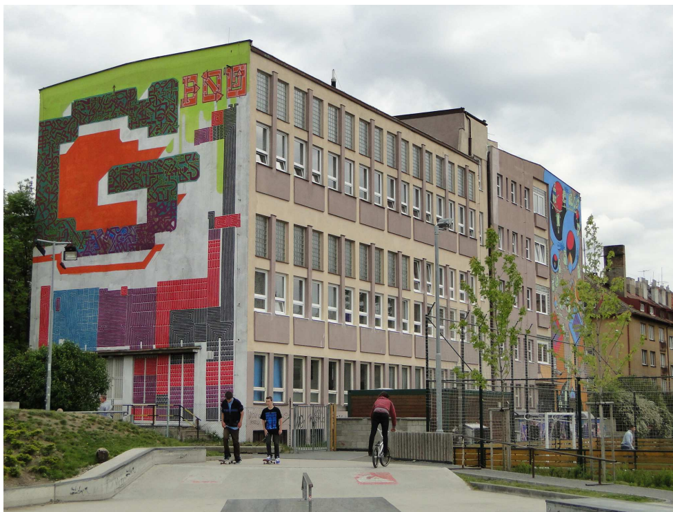
ZŠ Gutova získala novou podobu

ZŠ Gutova byla prvním místem, kde se v Praze 10 představil „mural art“, ale vedení této městské části doufá, že nebude poslední.