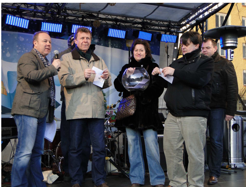
Prosincové losování o byty

Losování se stalo tradicí a těší se ze strany obyvatel Prahy 10 velkému zájmu, a proto ji chce městská část udržet i do budoucna.