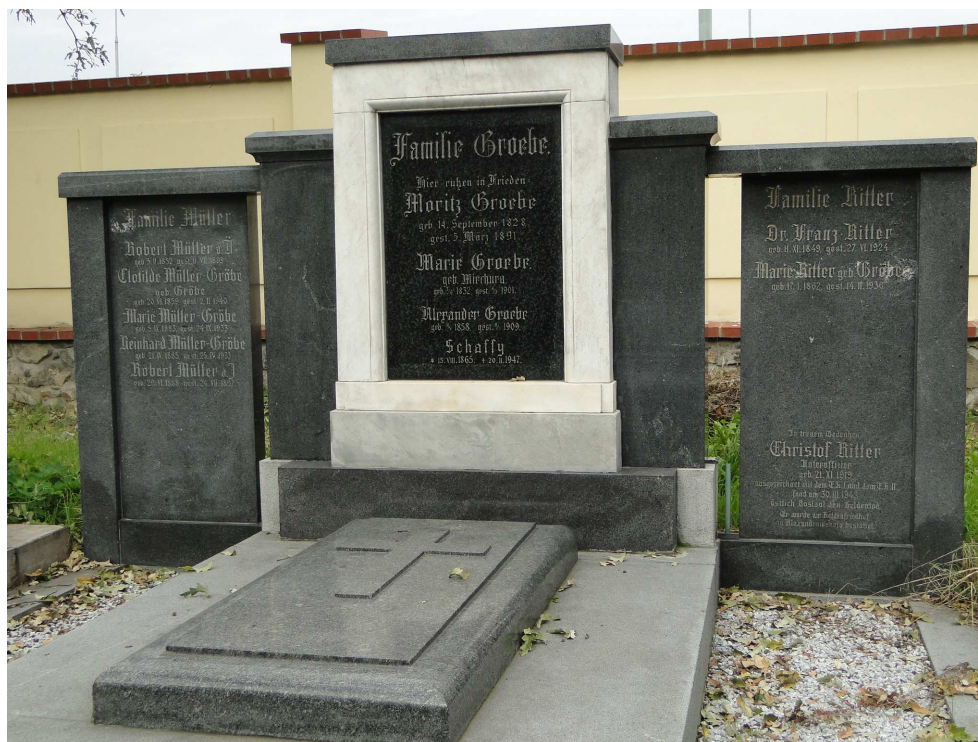
Německý evangelický hřbitov Strašnice – hrobka rodiny Groebe (Gröbe)