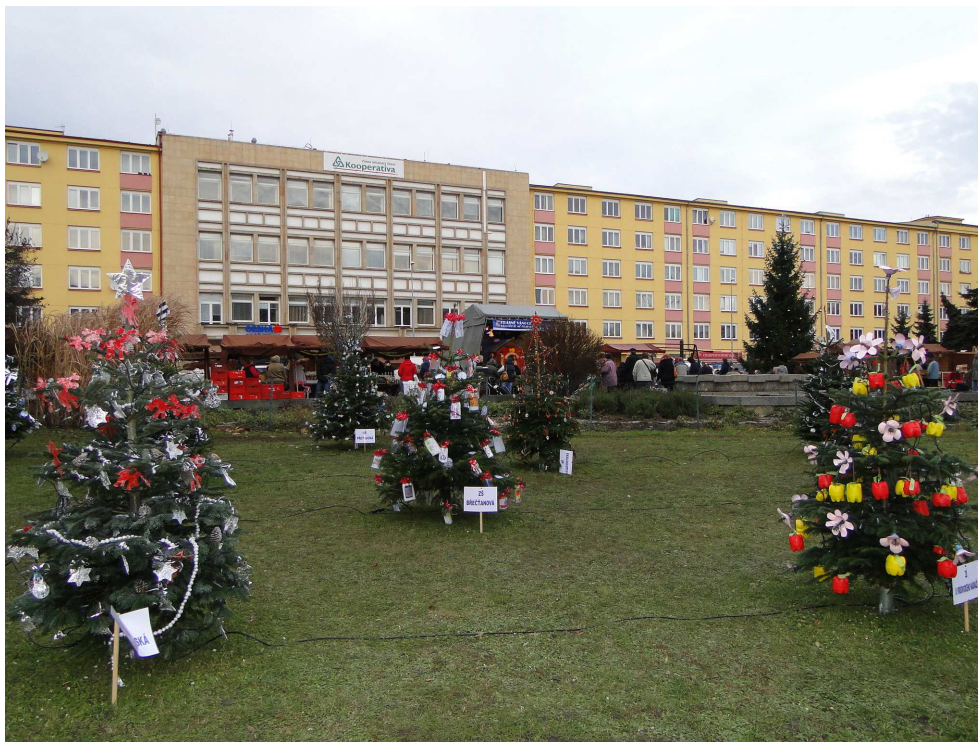
Vánoční stromky vyzdobené dětmi z mateřských a základních škol na Kubánském náměstí

Do tohoto kontrolního systému ještě městská část Praha 10 nepřímo zapojuje občany a samotné uživatele, kteří na veškeré zjištěné problémy mohou upozornit prostřednictvím komunikační služby MMS-podněty nebo přes kontaktní informace, které jsou k dispozici na návštěvních rádech všech dětských hřišť.