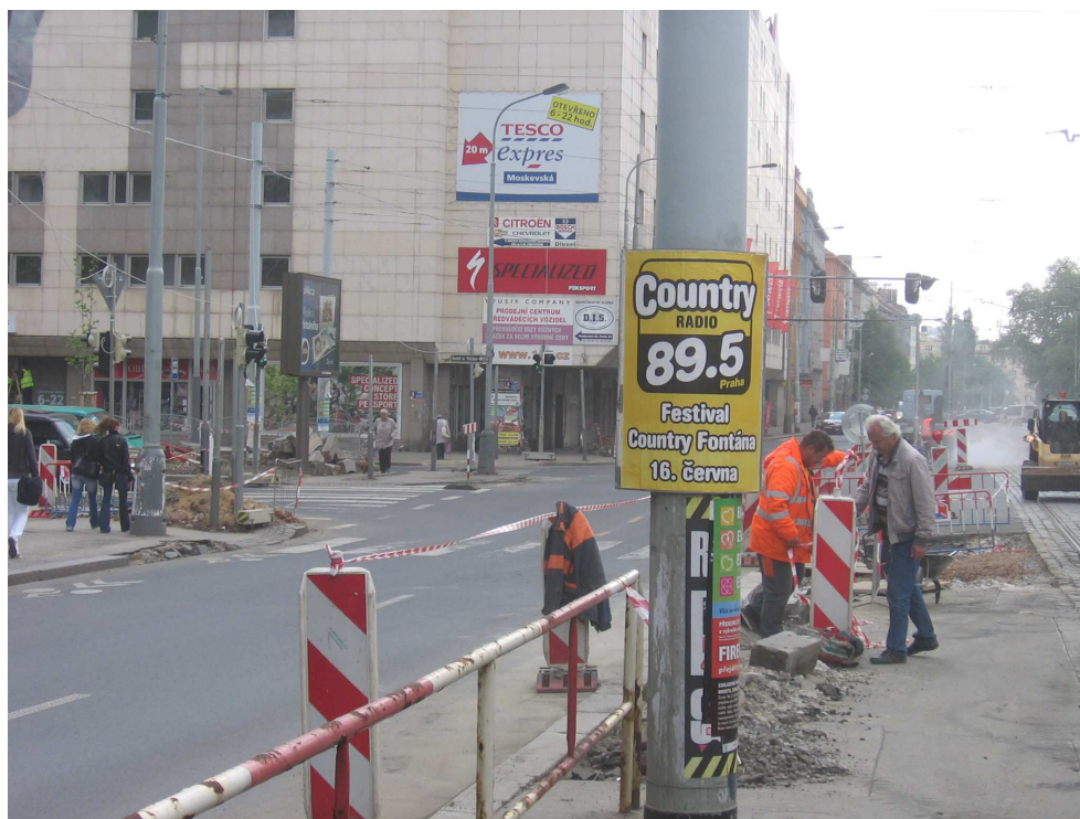
Křižovatka Vršovická x Moskevská se změnila

Přechody pro chodce přes Vršovickou ulici byly rozděleny bezpečnostními ostrůvky a zastávka tramvaje Koh-i-noor ve směru z centra byla propojena s ostrůvkem přechodu pro chodce. Dále byl rozšířen chodník na nároží továrny Koh-i-noor. Veškeré práce probíhaly za plného provozu, bez uzavírek.