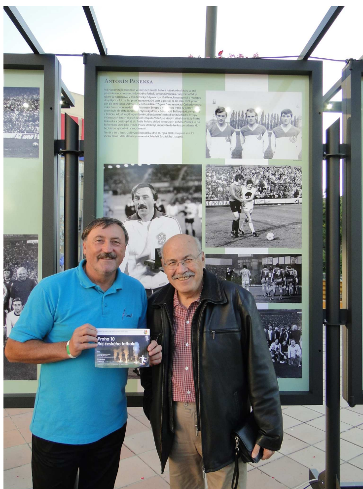
Výstava Ráj českého fotbalu

V rámci Dnů Prahy 10 byla městským úřadem Praha 10 před Nákupním centrem Eden uspořádána zajímavá výstava fotografií o historii dvou fotbalových klubů z Prahy 10 s dlouholetou tradicí. Výstava nazvaná Ráj českého fotbalu představila kluby SK Slavia Praha a Bohemians 1905 a návštěvníci si ji mohli prohlédnout od 3. 10. - 17. 10. 2011.