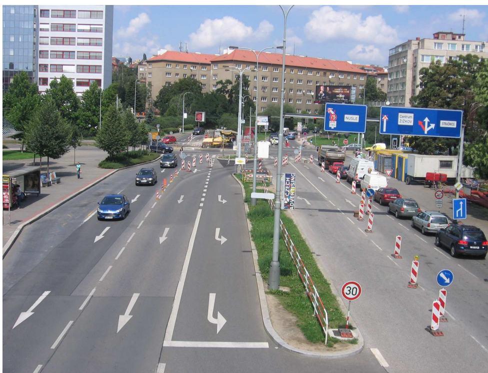
Průjezd křižovatkou Vršovická – Bělocerkevská byl značně omezen

Do 15. srpna pak byla kvůli opravě inženýrských sítí obousměrně uzavřena ulice Radošovická mezi ulicemi Strančická a Průběžná a jeden jízdní pruh ze směru z centra v ulici Průběžná. Uvedené omezení platilo v úseku ohraničeném ulicemi Ke Strašnické a Radošovická.