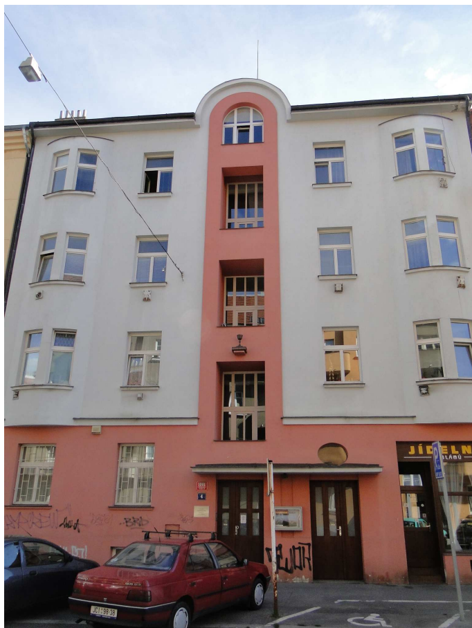
Farní sbor Českobratrské církve evangelické ve Strašnicích

Kromě toho se konal např. tábor strašnické nedělní školy v Dolním Bušínově, mládež vyrazila na Ohři nebo proběhl tradiční sborový víkend v Chotěboři.