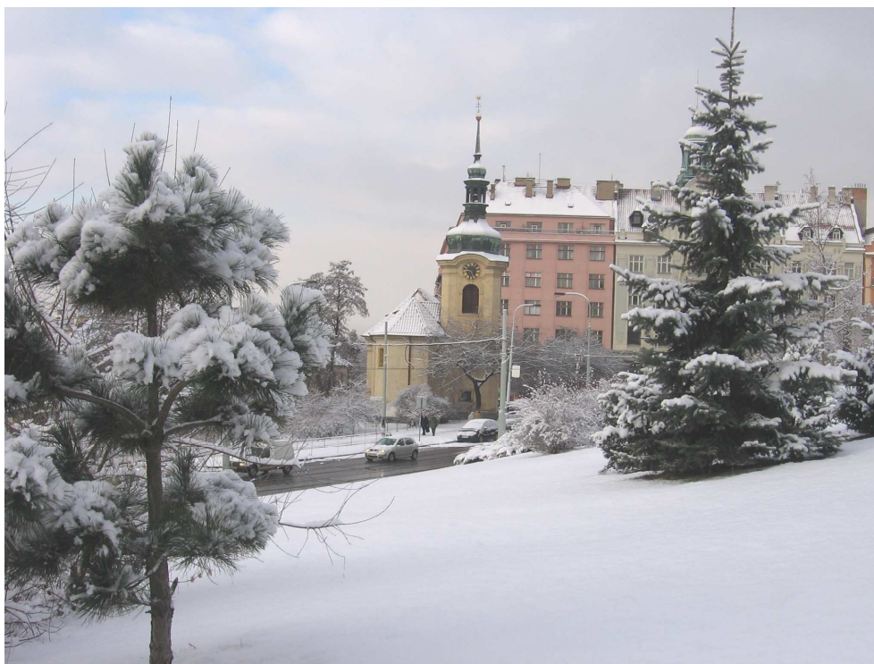
Kostel sv. Mikuláše

využívání prioritně řádných otevřených výběrových řízení – možnosti rámcové smlouvy pro centrální nákup = princip dvojité soutěže.