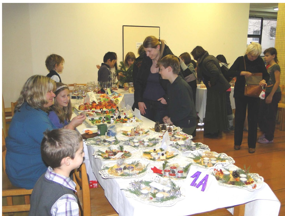
Prodej výrobků na vánočních trzích v ZŠ Olešská

14. 12. 2011 připravila ZŠ Olešská Adventní setkání v andělské škole . Od 15 do 15:30 se prodávaly výrobky vyrobené v kreativních dílnách. Od 17:00 hodin následoval vánoční program.