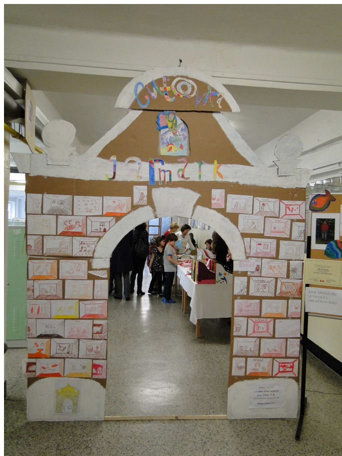
Jarmark v Gutovce