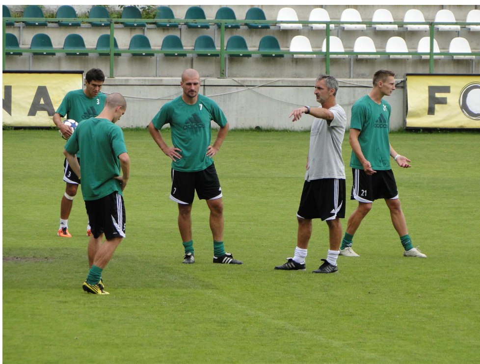
V Ďolíčku dál probíhají tréninky mužstva Bohemians 1905