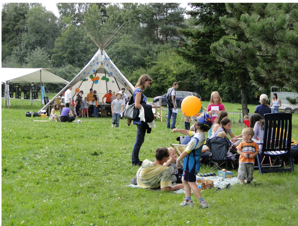
Den s přírodou

Akce se konala v sobotu 10. září od 10 do 16 hodin v Malešickém parku - horní kopec, ulice U Krbu. Den s přírodou finančně podpořila městská část Praha 10, Magistrát hl. m. Prahy a Národní síť EVVO.