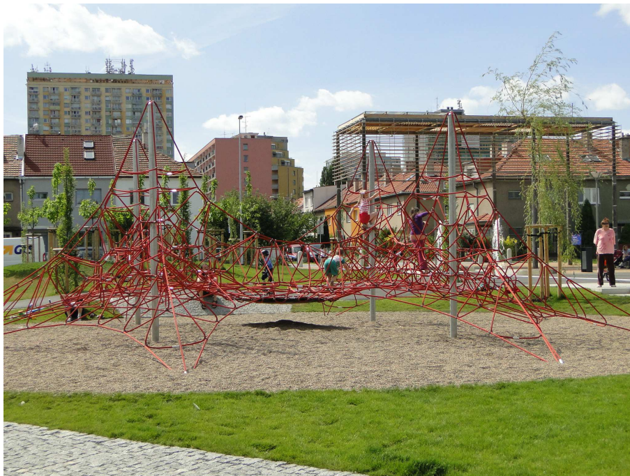
Park Chrprová - Malinová

Celkem se tohoto projektu zúčastnilo 120 maminek. Z 31 absolventek rekvalifikačních kurzů jich 20 následně našlo uplatnění na trhu práce.