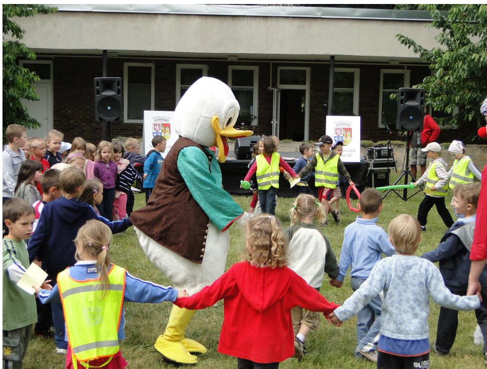
Den dětí Prahy 10

1. června proběhl v areálu Mateřské školy Magnitogorská Prahou 10 připravovaný Den dětí. Od 13 do 15 hodin byl připraven program pro děti z mateřských škol. Od tří do pěti pak následovala zábava pro veřejnost. Na děti čekal klaun Chiko, soutěže o ceny, hudba a zábava.