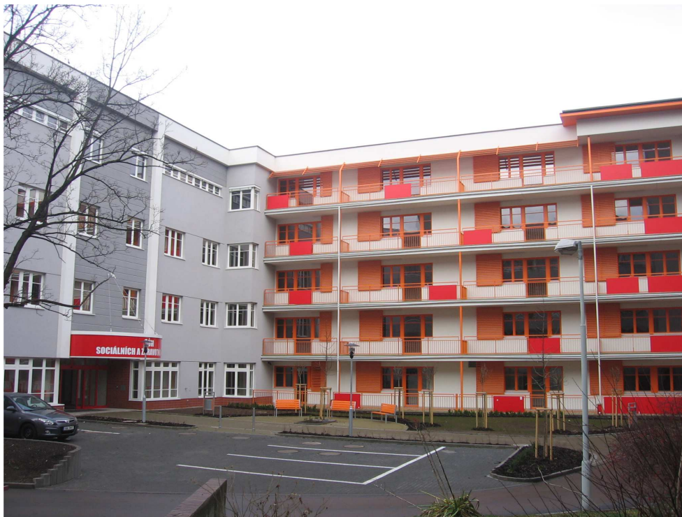
Dům sociálních a zdravotních služeb Sámova v prosinci 2011

Současně se pracovalo na zateplení fasády, rekonstrukci hlavní recepcce a bezbariérového vstupu do budovy Domu s pečovatelskou službou Sámova.