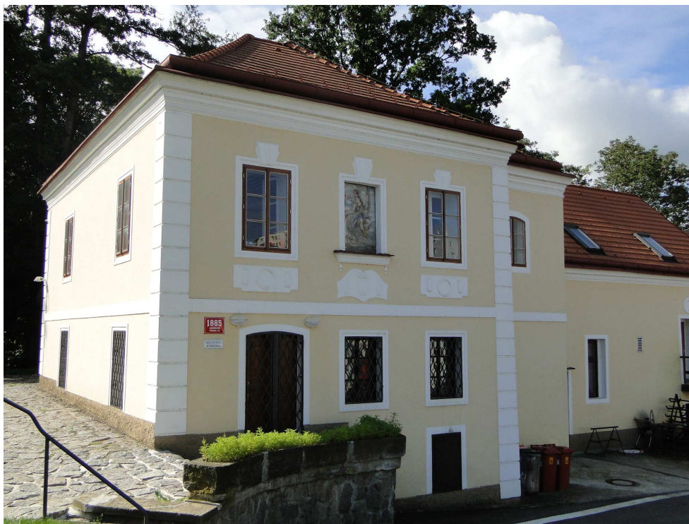
Vodní mlýn v Záběhlicích