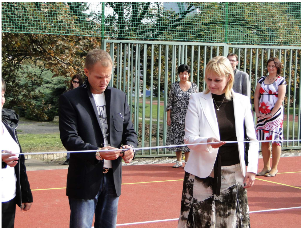
Slavnostní otevření nového hřiště

Většina prvňáčků nešla do neznámého prostředí, neboť již využili možnost školu navštěvovat díky projektu „Škola nanečisto“. Při něm se seznámili s prostředím školy, poznali svoji paní učitelku a hravou formou si zkusili některé dovednosti, které ve škole potřebují.