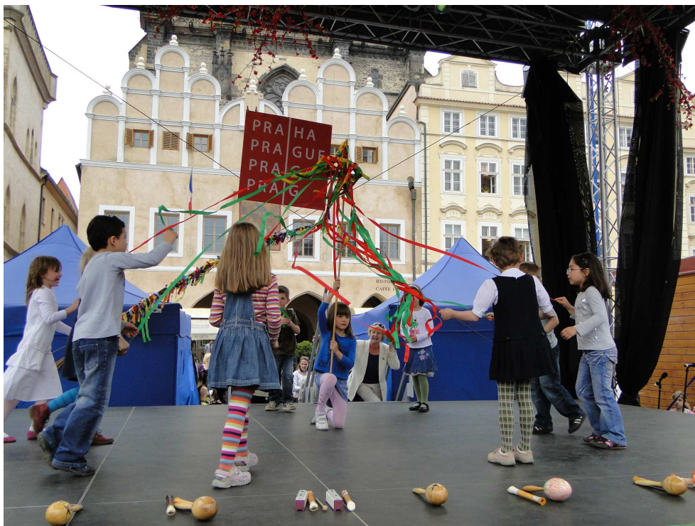
Velikonoční trhy na Staroměstském náměstí

Jako každý rok, tak i letos, se konaly na Staroměstském náměstí velikonoční trhy. Tradičně na tomto jarním programu probíhá prezentace připravená mateřskými, základními a uměleckými školami, zájmovými kroužky, soubory a občanskými sdruženími, které mají sídlo nebo rozvíjejí svoji činnost v Praze 10. Zástupci MČ Praha 10 vystoupili 28. dubna 2011.