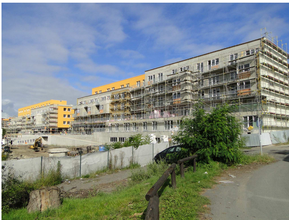
Kaskády u Botiče

Internetové stránky jsou: www.geosan-development.cz