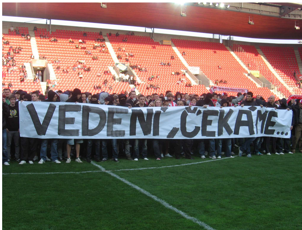
Na začátku byl pokojný protest ...

Fanoušci Slavie naplánovali pokojnou akci , která měla proběhnout v případě, že skutečný majitel Slavia do čtvrtka neoznámí další kroky při řešení ekonomické krize klubu, což se nestalo, a tak před úvodním hvizdem zápasu v 18:25 začaly stovky fanoušků přeskakovat hrazení a zaměřily ke středovému kruhu. Na fotbalové ploše se odhadem sešlo 1 500 lidí. Ti se otočili směrem k hlavní tribuně s velkým transparentem „Vedení, čekáme ..“ Dav na hrací ploše pokřikoval například „My jsme Slavia, vy nejste nic,“ "My chceme pravdu. Ať žije Slavia!" nebo „Sisáku, ty hovado,“ což bylo adresováno údajnému vlastníku klubu.