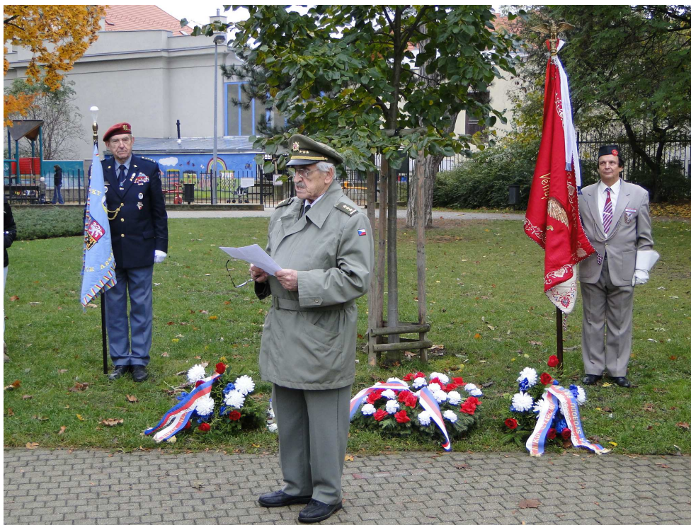
Vzpomínka 93. výročí vzniku Československé republiky

Toto kontaktní centrum mohli navštěvovat od konce listopadu 2011 mladí lidé z rozvrácených rodin a dětských domovů, kteří se často živí třeba jako prostituti. Prostory dříve odmítaly poskytovat městské části. Nakonec dočasně na rok pomohl stát.