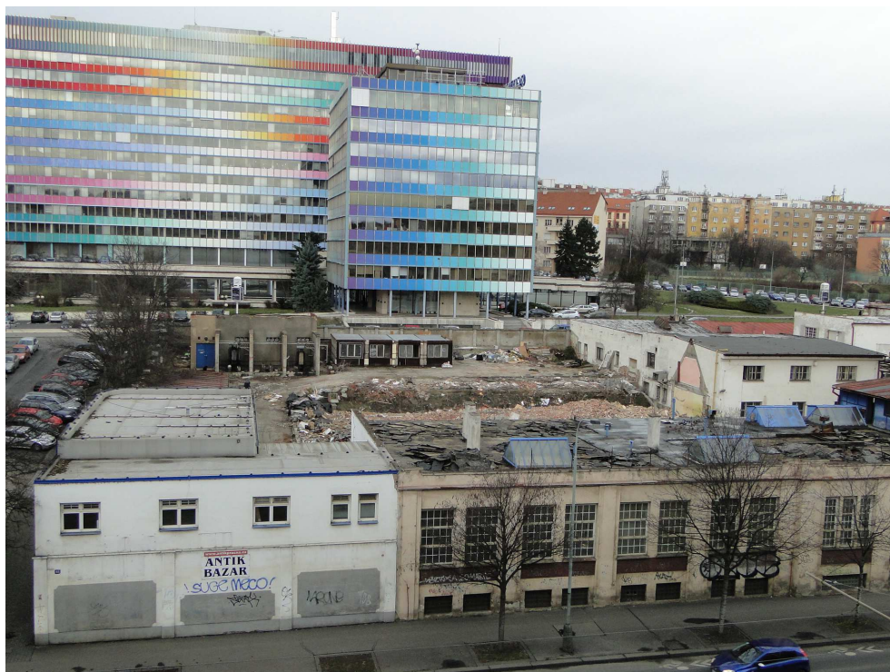
V lednu 2015 se boural areál Tesla