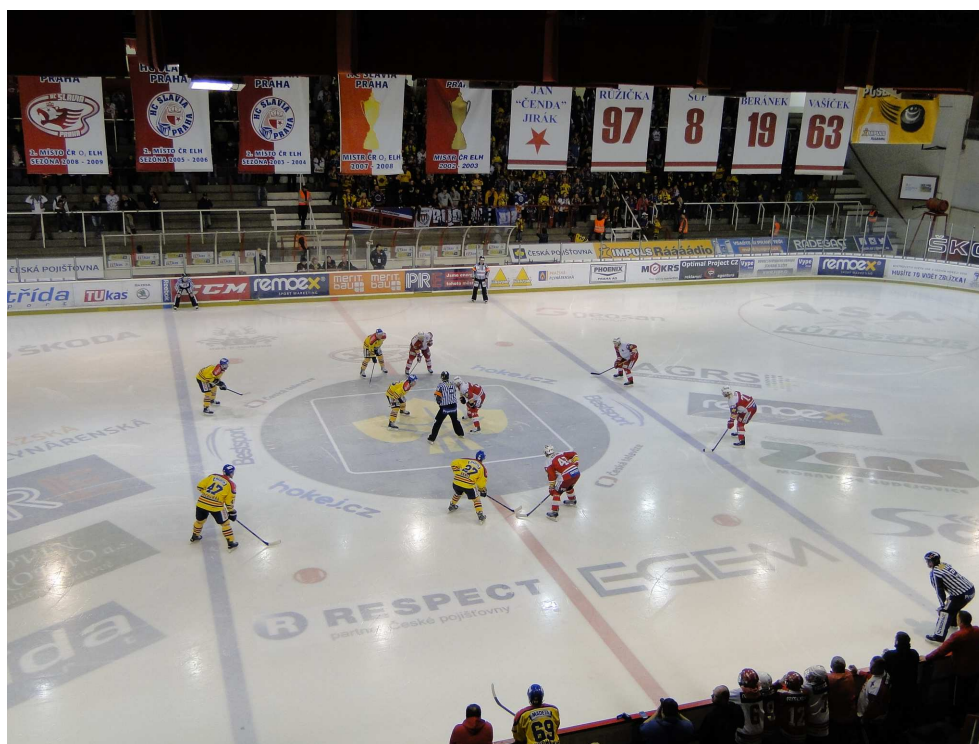
Slavia hrála barážové zápasy v Edenu

V neděli 22. března Karlovy Vary: Slavia 3:2.