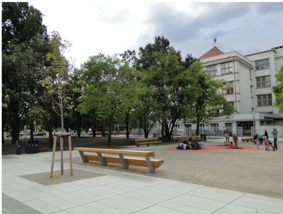
Zrevitalizovaný park Jiřiny Haukové a Jindřicha Chalupeckého

Parková plocha vznikla už v roce 1938 a většina výsadby pochází z 50. let, vyskytují se v ní především duby, javory a platany.