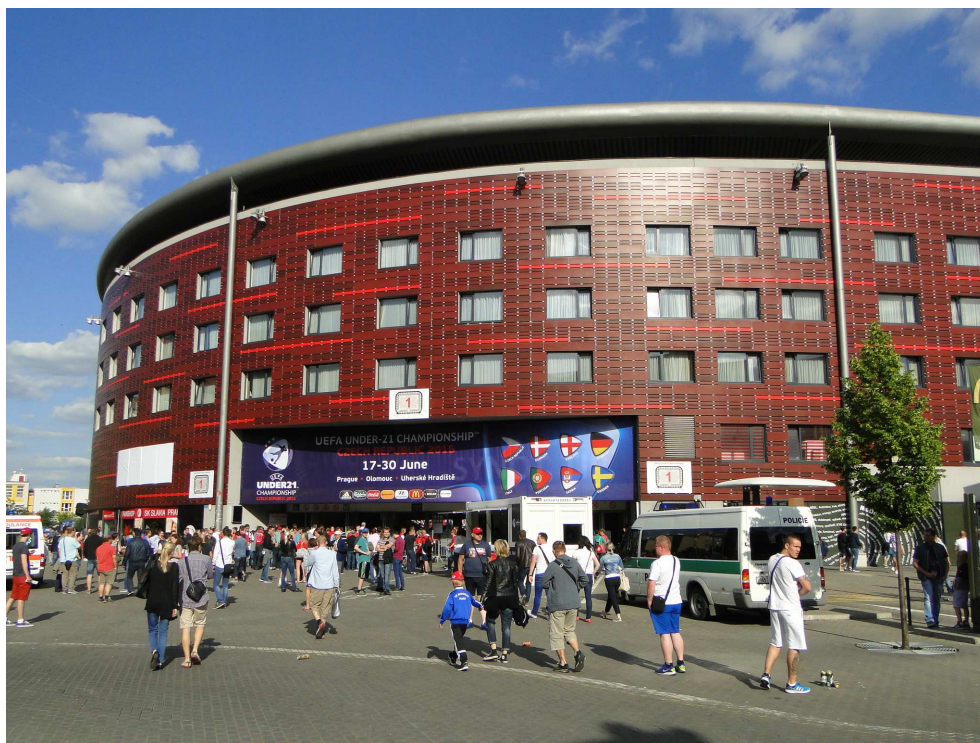
ME do 21 let se hrálo v Edenu

Mistrovství Evropy do 21 let se poprvé v historii konalo v České republice. Zápas se hrály v červnu v Praze v Edenu a na Letné, v Olomouci a v Uherském Hradišti. Čeští fotbalisté těsně nepostoupili ze základní skupiny. ME vyhráli hráči Švédska.