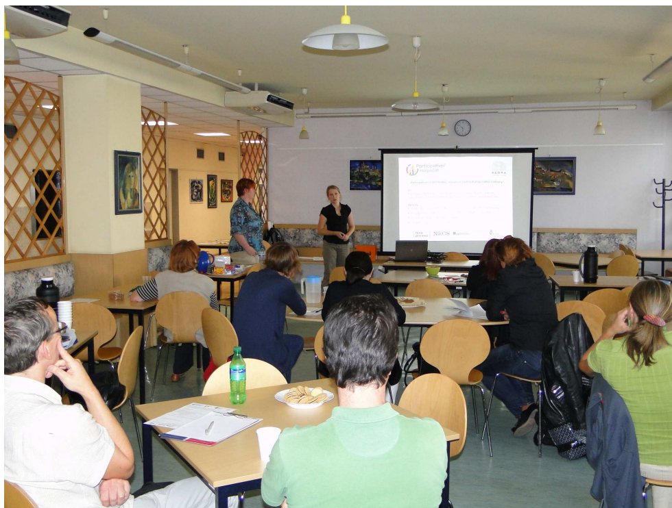
Setkání v rámci projektu Moje stopa