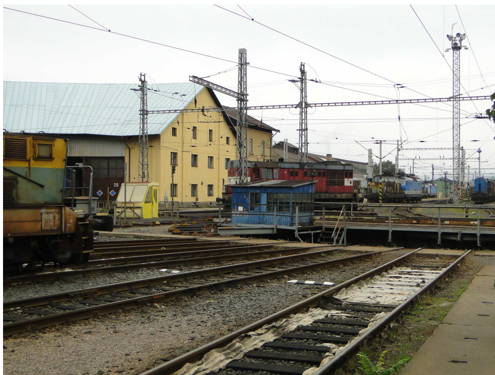
Železniční výtopna s točnou lokomotiv pod Bohdalcem

Památka byla přístupná 12. a 13. září od 9:00 do 15:00 hodin. Komentované prohlídky začaly každých 30 minut na prostranství u jižní rotundy, délka prohlídky byla cca 45 min. Poslední návštěvníci vycházeli ve 14:00 hodin. Jelikož se prohlídky konaly za plného provozu, museli účastníci respektovat pokyny organizátora. V areálu se nesmělo pohybovat mimo přímý dozor průvodce.