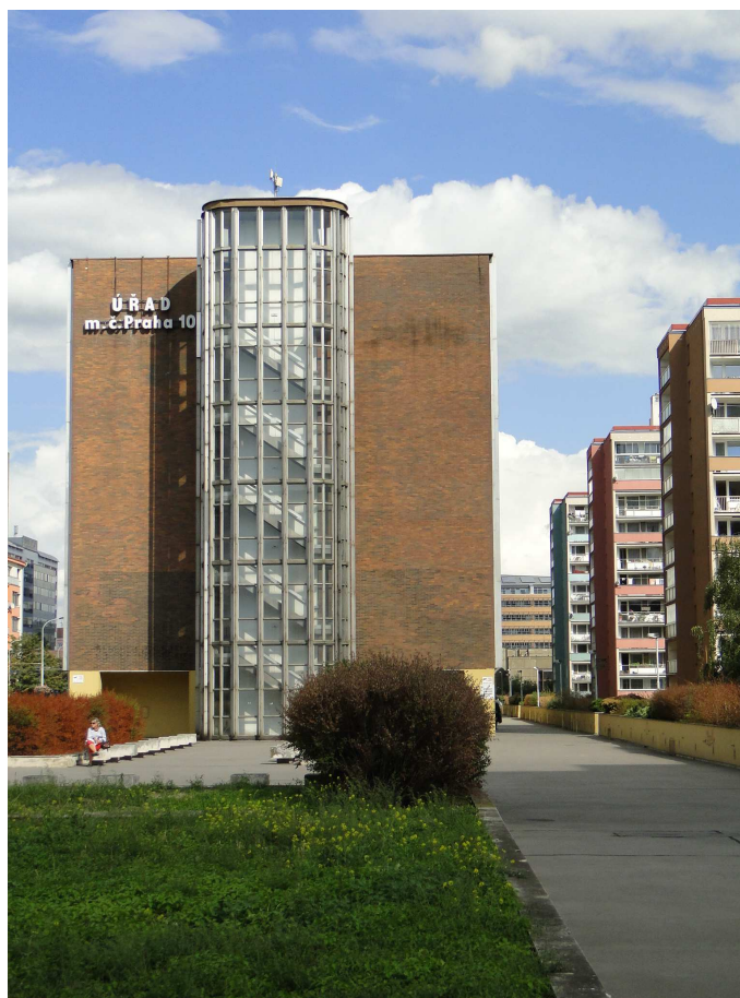
Budova ÚMČ Praha 10

Počet platných hlasů pro „ANO“ 4 053, pro „NE“ 1 068 a zdrželo se 635.