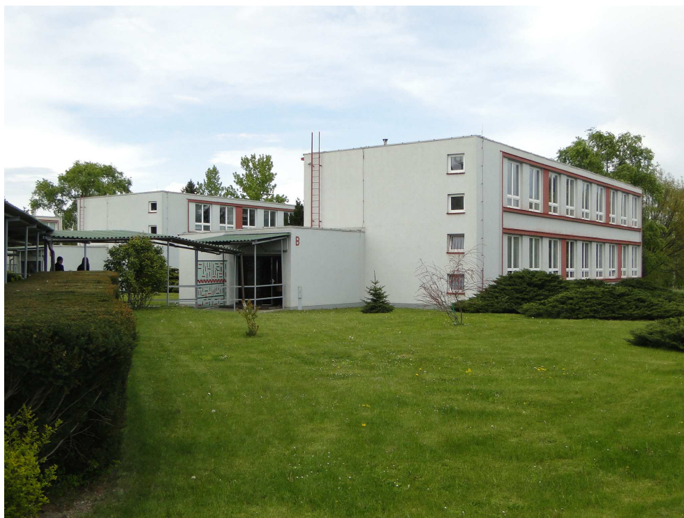
Střední odborné učiliště gastronomie

známého kuchaře Ondřeje Slaniny hodnotila výkony. Podobně se mohli svými dovednostmi pochlubit i číšníci a cukráři. Současně probíhal i den otevřených dveří.