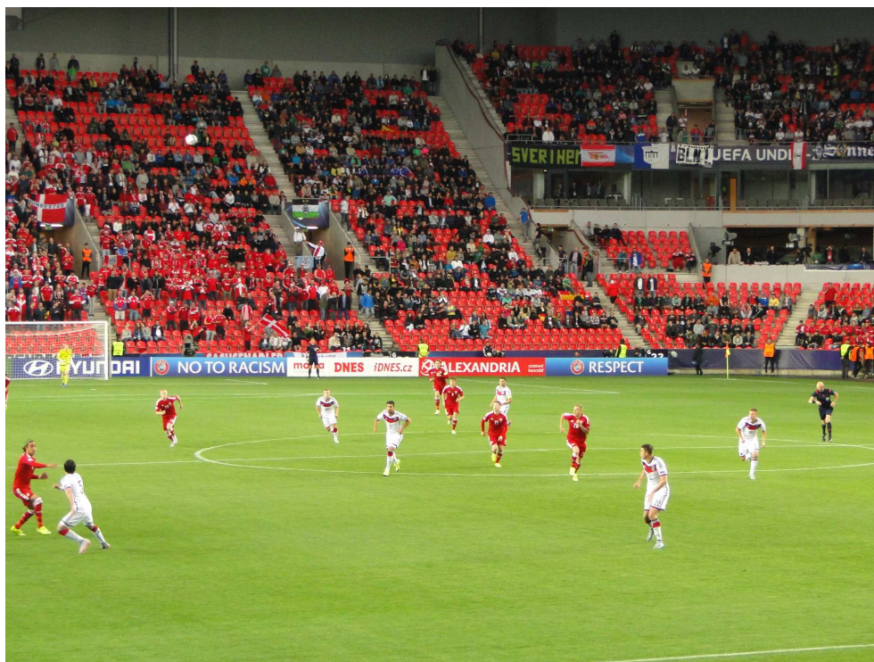
Zápas mezi fotbalisty Německa a Dánska se hrál 20. června v Edenu