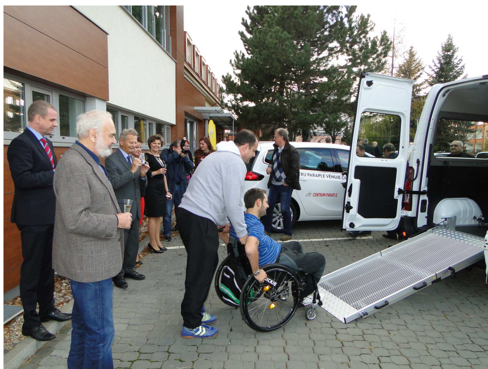
Předání tří vozů Opel Centru Paraple