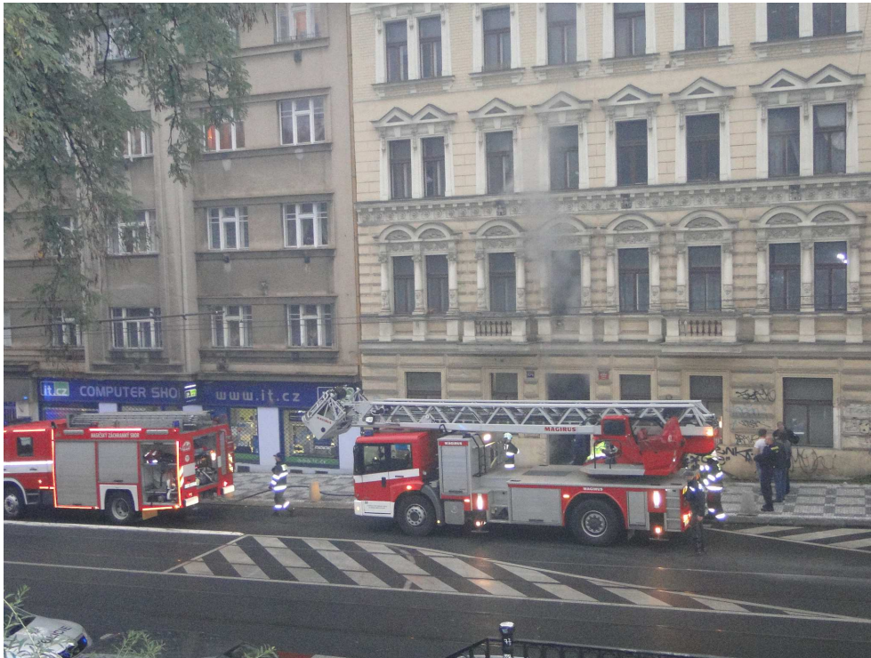
Zásah hasičů ve Francouzské ulici (14. 10. 2015)