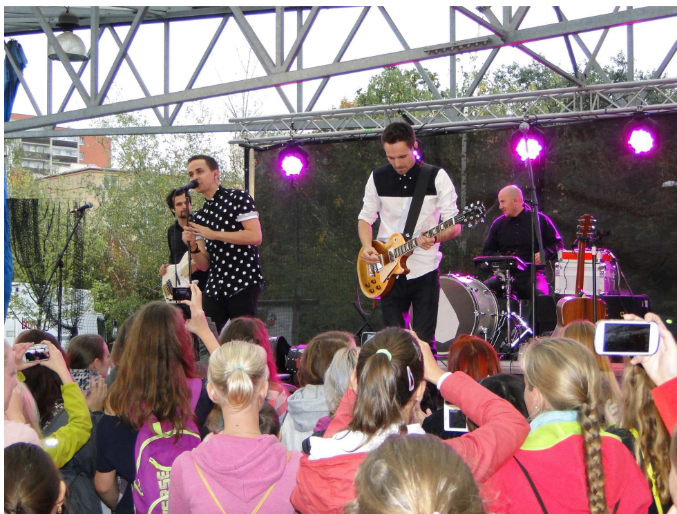
Skupina Slza vystoupila na Gutovce v rámci Dnů Prahy 10

Celé odpoledne navíc probíhal doprovodný koncert. Od třinácti hodin se o zábavu starala dvojice DJ Robot a DJ Jorgos. Od 18:00 hodin následoval hlavní koncert pražské ska-reggae kapely Fast Food Orchestra; ta za více než deset let aktivního vystupování se svým repertoárem objela téměř celou Českou republiku a opakovaně se také objevila na pódii zahraničních klubů a festivalů. Během svého působení hrála skupina i po boku kapel jako The Toasters, Piflers, Hotknives, Panteon Rococo, Slackers nebo Selecter.