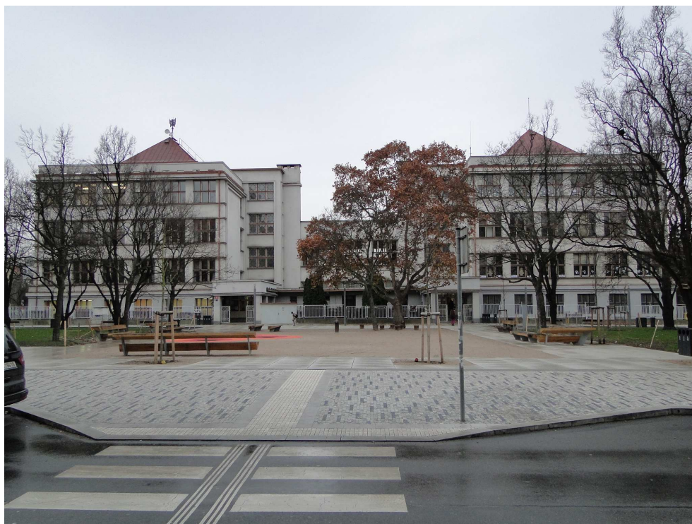
ZŠ U Vršovického nádraží