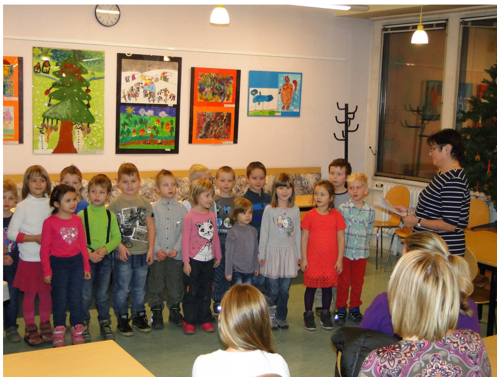
Vystoupení dětí z MŠ Omská na vernisáži Svět kolem nás a vánoční čas