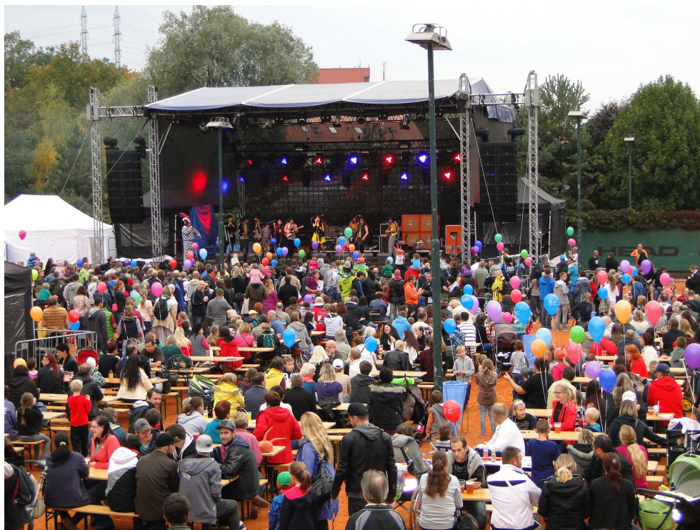
Velký koncert na Hamru v rámci Dnů Prahy 10