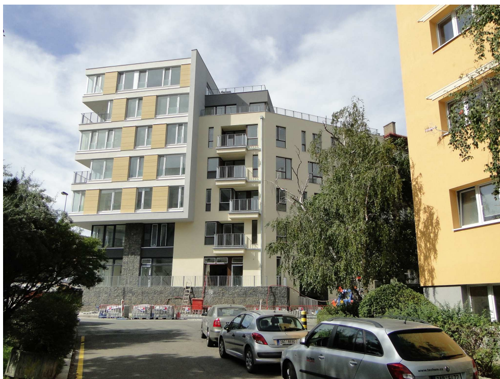
Rezidence U Roháčových kasáren

Informace na stránkách: http://www.akroreal.com/nabidka-bytu .