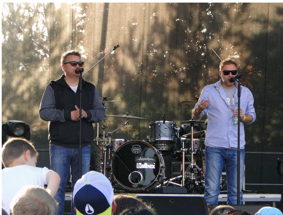
Vystoupení skupiny Těžkej Pokondr na Májových slavnostech