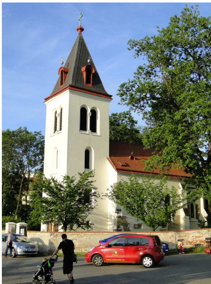
Kostel Narození Panny Marie