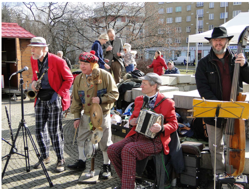
Vystoupení na farmářských trzích 7. března 2015

Zimní úklid je zajišťován smluvní dodavatelskou firmou a průběžně kontrolován pověřenými pracovníky úřadu. Kontrolní činnost v době sněhových podmínek probíhá každodenně. Do úklidových prací jsou zařazovány i osoby, které pro městskou část vykonávají obecně prospěšné práce. Celkový výčet ulic, které zařadila radnice do svého úklidu, je zveřejněný na internetových stránkách www.praha10.cz/verejneprostory . Zde je k dispozici i mapový podklad, ve kterém je zimní úklid vyznačený. Na internetu je možné také dohledat informace týkající se údržby vozovek. Tu na území hlavního města zajišťuje TSK. Plán údržby včetně interaktivní mapy s vyznačením pořadí úklidu vozovek je přístupný na stránkách www.tsk-praha.cz pod odkazem „zimní údržba komunikací“.