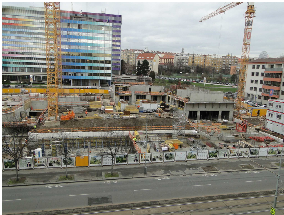
Práce na rezidenci 4Blok

Internetové stránky jsou: http://www.4blok.cz/ .