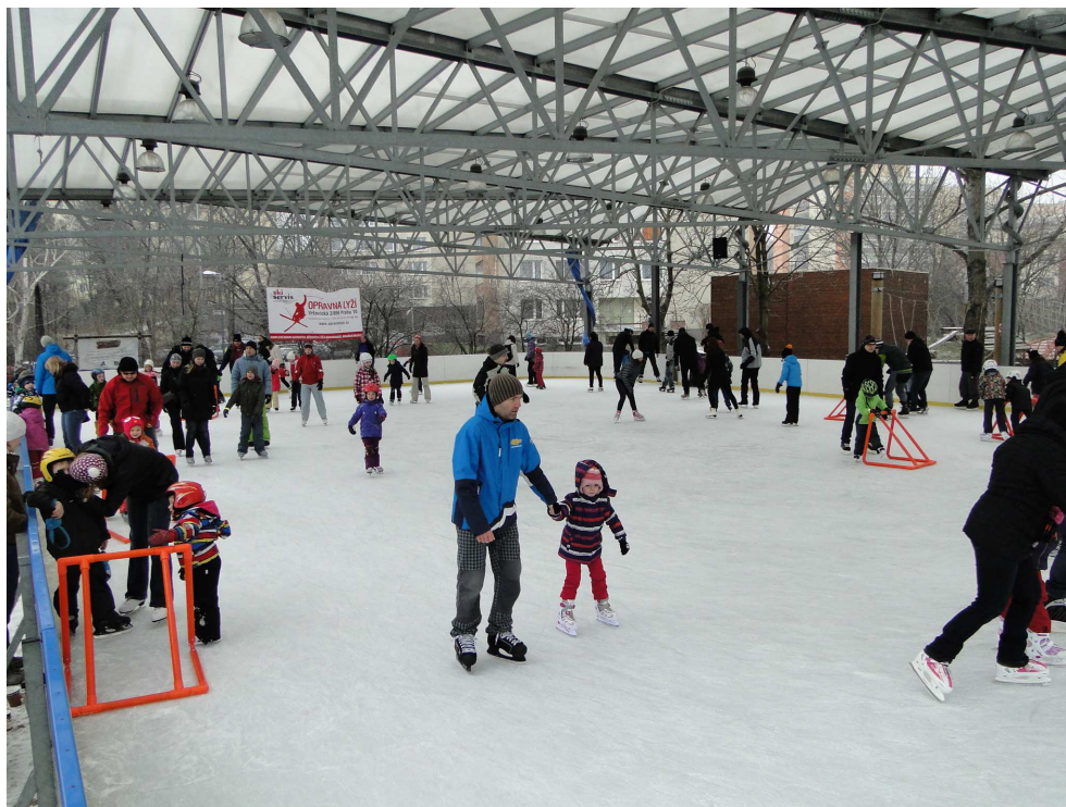
Bruslení na Gutovce

V letošním roce byly na tento projekt vyčleněny finanční prostředky ve výši 300 tisíc Kč. Žádost o finanční dar bylo možné podat do 4. 9. 2015 v podatelně Úřadu MČ Praha 10. Finanční příspěvek byl určen těm osobám, které měsíčně hradí provoz tísňové péče nebo si v letošním roce pořídily zařízení tísňové péče.