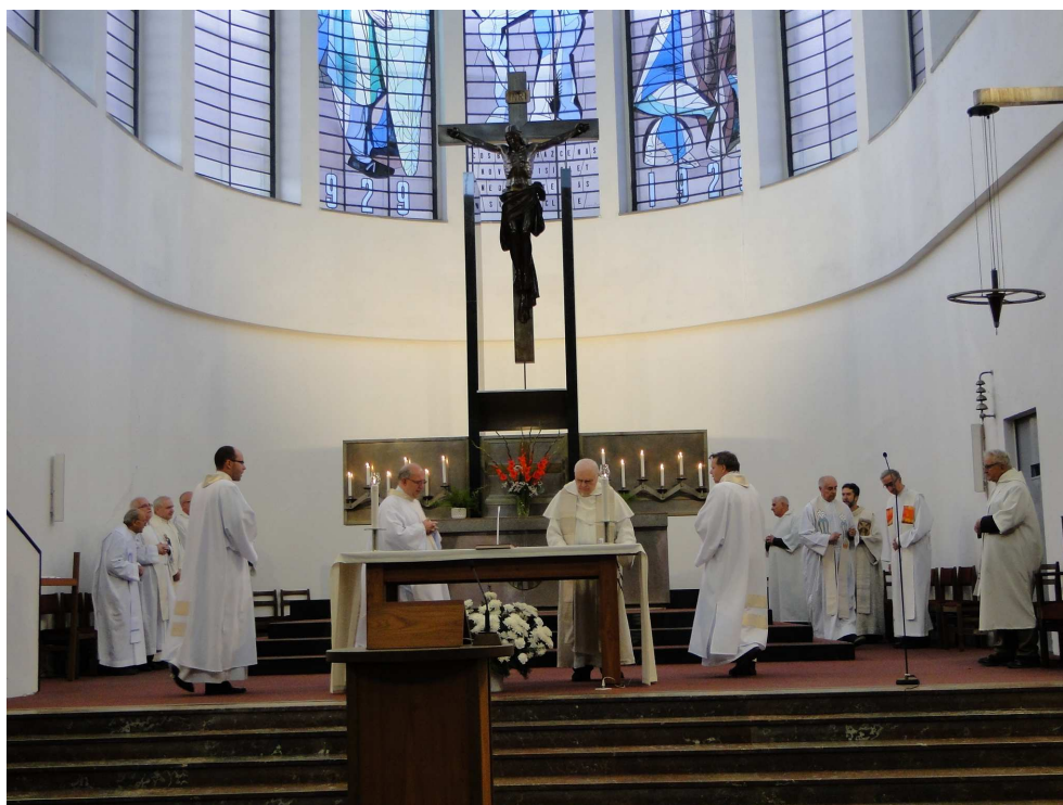
Bohoslužba kněží se vztahem k Vršovcím (18. 9. 2015)