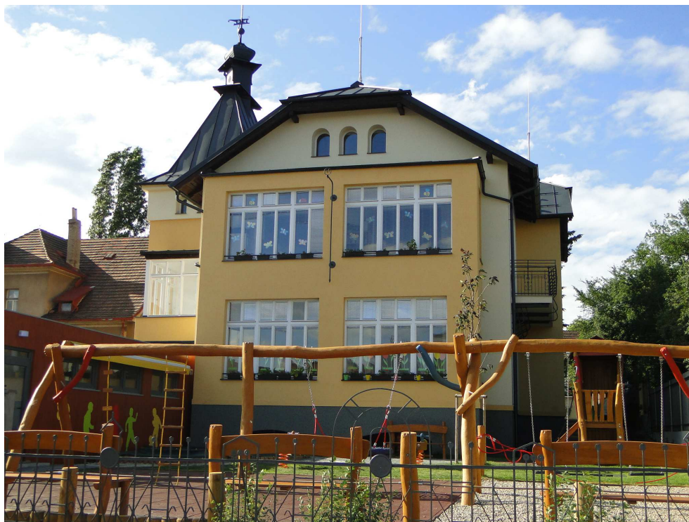
Nově otevřená mateřská školka v Mrštíkově ulici