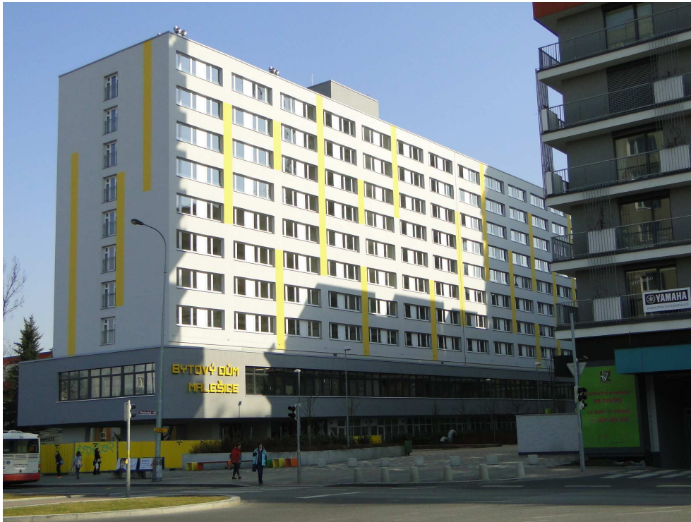
Bytový dům Malešice