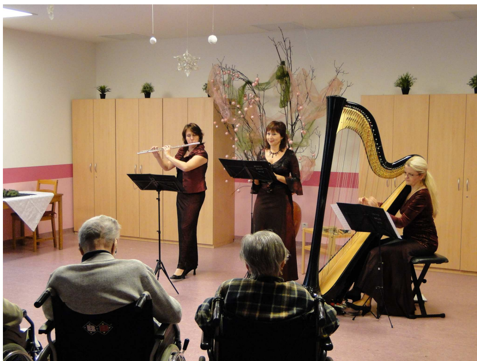
Vánoční koncert souboru Musica Dolce Vita

Městská část Praha 10 připravila vánoční koncerty . V pondělí 14. 12. od 14 hodin v DS Vršovický zámek vystoupil komorní soubor Maurice. 14. 12. od 15 hodin v DS U Vršovického nádraží se představil soubor Musica Dolce Vita a 15. 12. od 14 hodin v DS Zvonková zahrál v rámci adventního koncertu komorní soubor Canto Corno Con Vera.