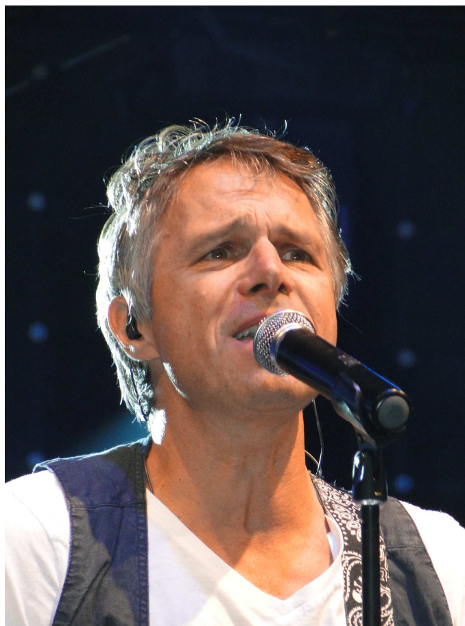
Na Hamru vystoupil v rámci Dnů Prahy 10 i Janek Ledecký

10. října od 9 do 11.30 hodin proběhla také speciálně připravená pohádková stezka v Heroldových sadech, kterou si mohly děti projít a přitom plnit nejrůznější úkoly a rozličné zábavné soutěže a hry.