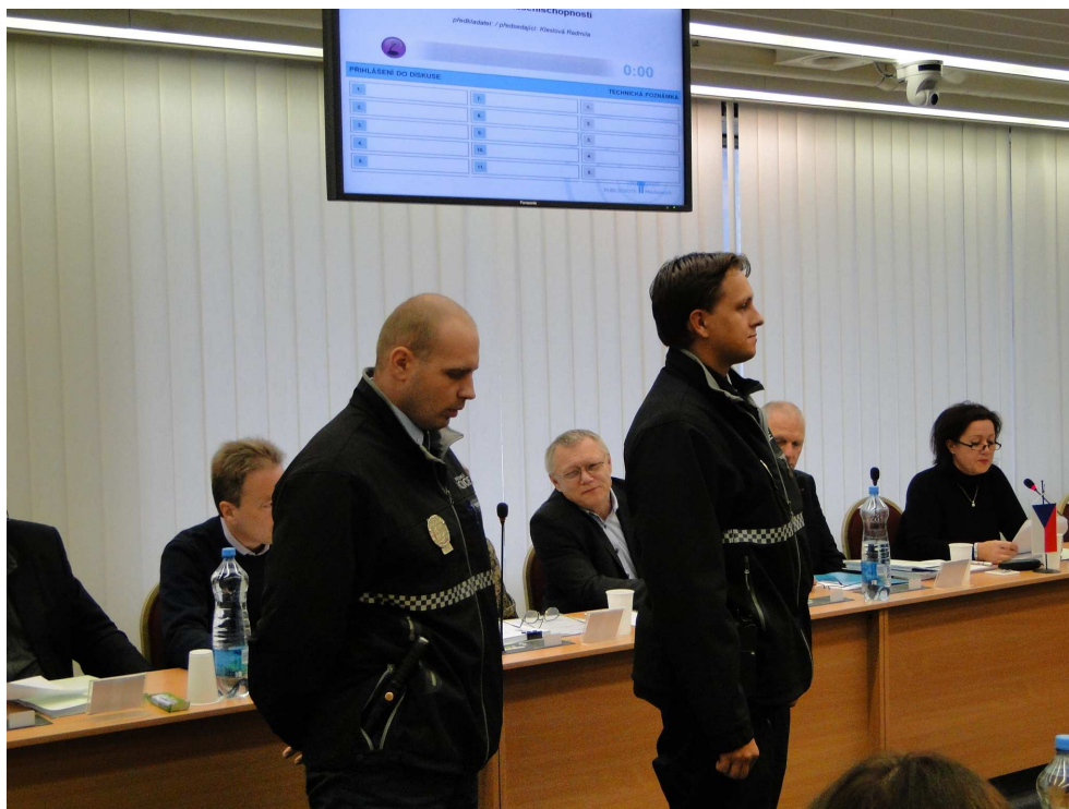
Ocenění strážníků Městské policie Praha 10

V 13:30 hodin poděkovala paní starostka všem za účast a ukončila zasedání Zastupitelstva MČ Praha 10.