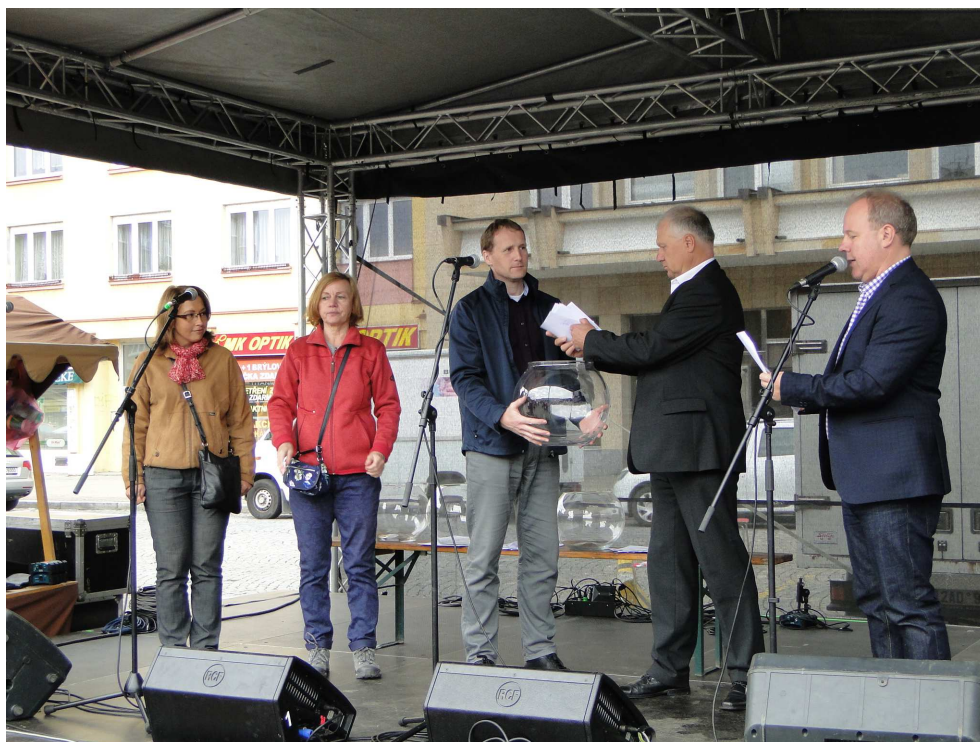
Losování bytů na Kubánském náměstí 10. října 2015

za první měsíc nájemního vztahu v KČ, či například závazek žadatele k provedení nezbytných stavebních úprav v bytě na jeho náklady.