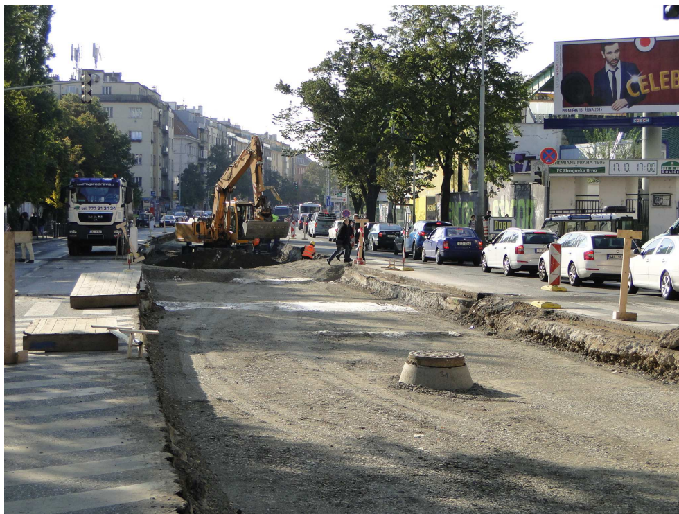
Rekonstrukce Vršovické ulice