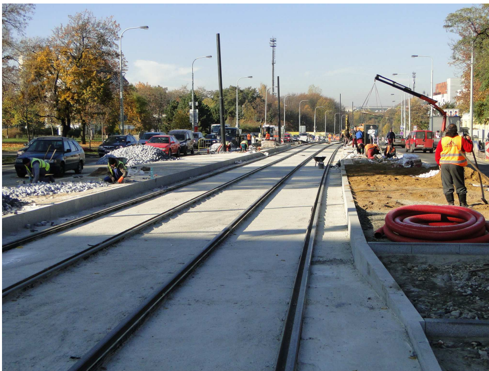
Rekonstrukce Vršovické ulice (zastávka Nádraží Vršovice)

V letošním roce se v hlavním městě rekonstruovala řada tramvajových tratí (např. Plzeňská nebo Evropská). Důvodem bylo dočerpávání finančních prostředků z EU, a proto intenzivní stavební ruch pokračoval i na podzim.