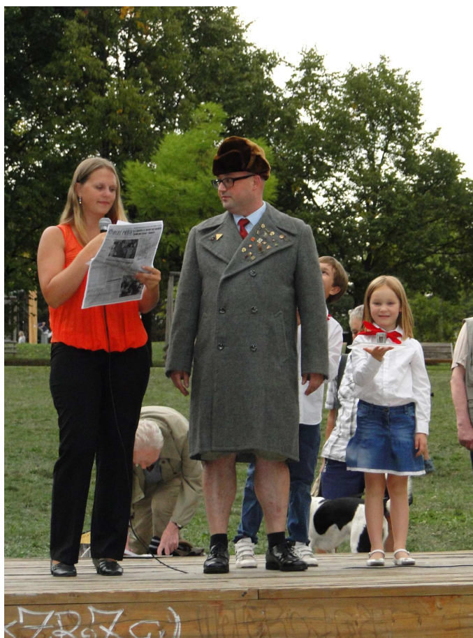
Na výstavě Naše Malešice byly připomenuty osobnosti spojené s Malešicemi (např. N. Chruščov)