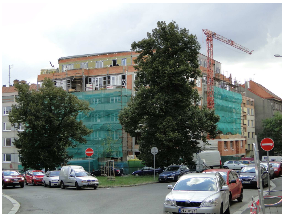
Výstavba v Rostovské ulici