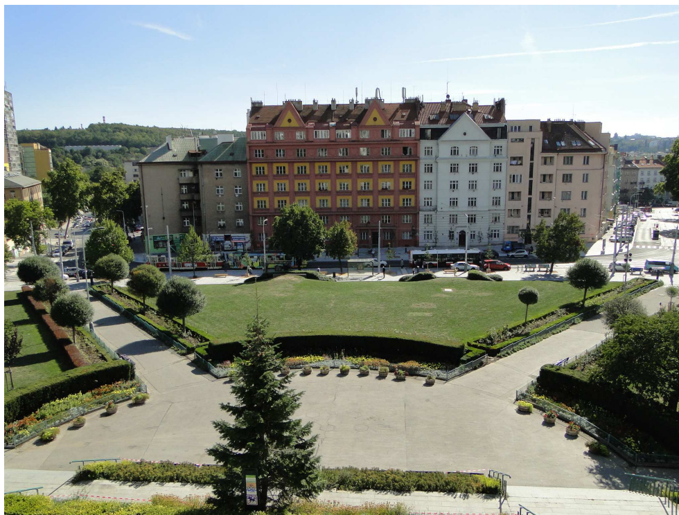
Náměstí Svatopluka Čecha s novou tramvajovou zastávkou

Mnoho dohadů vyvolalo zavedení zákazu vjezdu do části Moskevské ulice, kde policisté občas pokutují řidiče, kteří tento zákaz nedodržují. Podle radnice se v plánech s vytvořením této klidové zóny vůbec nepočítalo. Tento požadavek vznikl až na popud Institutu plánování rozvoje hl. m. Prahy.