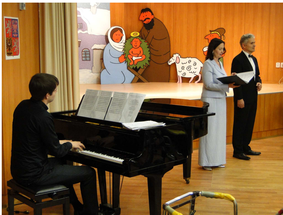
Vánoční koncert v DS Malešice

Internetové stránky jsou: http://www.dszm.cz .