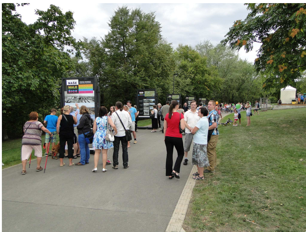
Výstava Naše Malešice ze Zásobníku projektů – město na míru měla velký úspěch

Akce se konala pod záštitou starostky Prahy 10 Radmily Kleslové. A protože měla velký úspěch, chce ji vedení Prahy 10 příští rok znovu zopakovat.