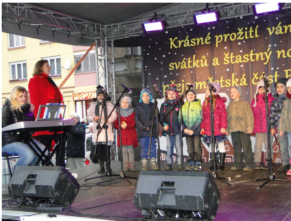
Vystoupení dětí na vánočních trzích

Do konce listopadu byla k vidění výstava Má vlast – cestami proměn, jejíž jedna kolekce byla i v oplocené části Heroldových sadů. Praha 10 se do cyklu putovní výstavy zapojila již potřetí. Předloni s projektem renovace parku Chrpová – Malinová, v loňském roce s akcí revitalizace Malešického parku a letos s revitalizací Moskevské ulice. Výstava dokumentovala zvelebování různorodých míst v sídlech i krajině – domů, náměstí, sakrálních objektů, parků, nádraží apod. po celé republice. Kolekce vystavená v Heroldových sadech zobrazovala 21 takových proměn. Náhled proměn ze všech koutů republiky byl na webových stránkách http://www.cestamipromen.cz/hlasovani , kde šlo pro nejzdařilejší změnu hlasovat. Putovní výstava je připravena sdružením Entente Florale CZ – Asociace Souznění.