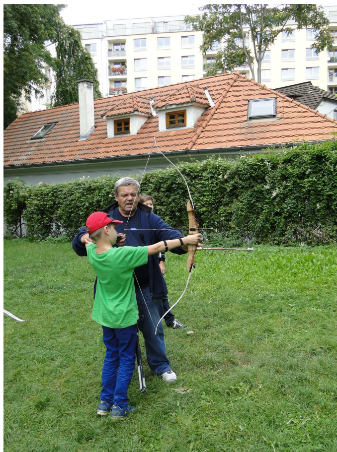
Noc Sokoloven ve Vršovicích

V Praze 10 je i TJ Sokol Praha Strašnice , který sídlí na adrese Saratovská 4/400, Praha 10 – Strašnice.