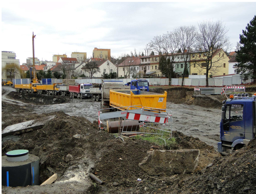
Terasy Strašnice (prosinec 2015)