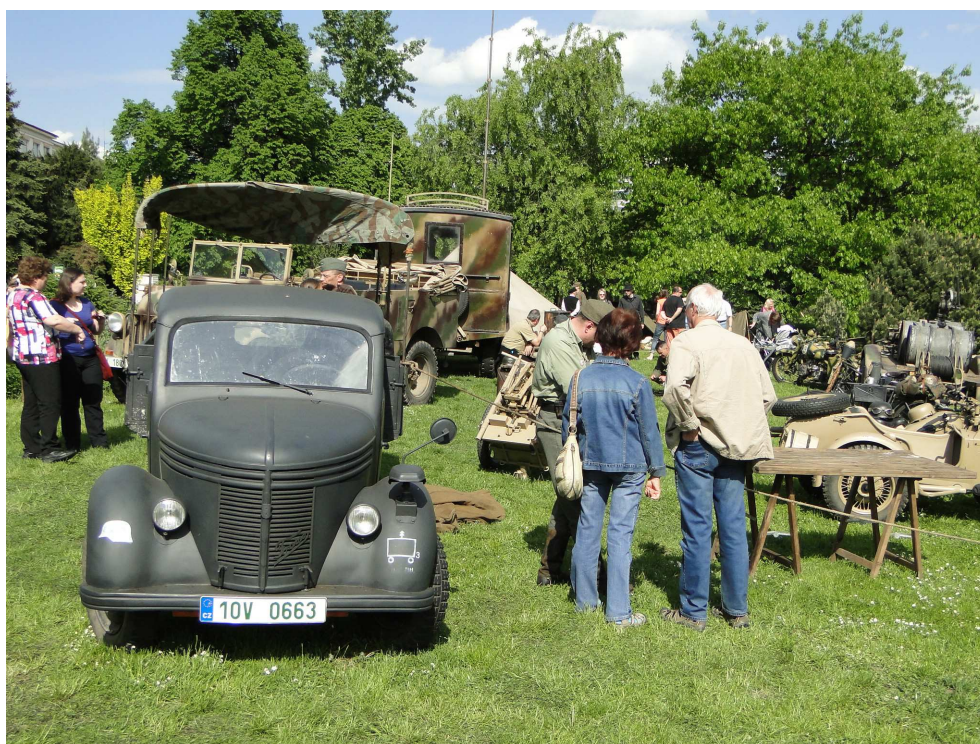
Oslavy 70. výročí osvobození Československa na Kubánském náměstí

Povstalcům se podařilo přimět Němce ke kapitulaci, zabránit mnohonásobně většímu krveprolití a vyprovokovali i rychlejší zásah Rudé armády. Po roce 1948 byli perzekuováni hlavní představitelé povstalců; velitel povstání generál Karel Kutlvašr byl odouzen k doživotnímu vězení.