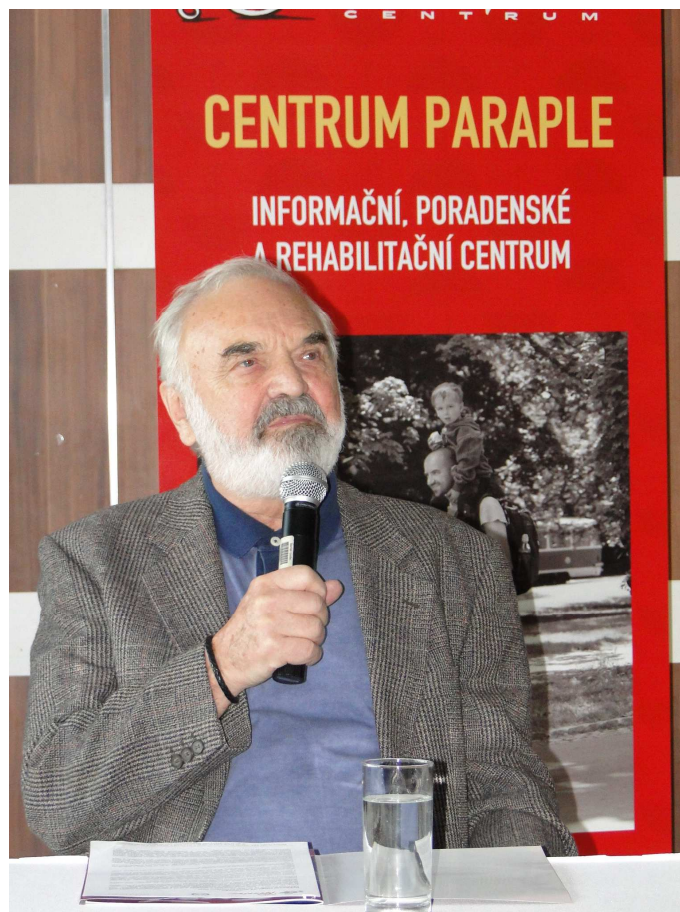
Herec Zdeněk Svěrák v Centru Paraple