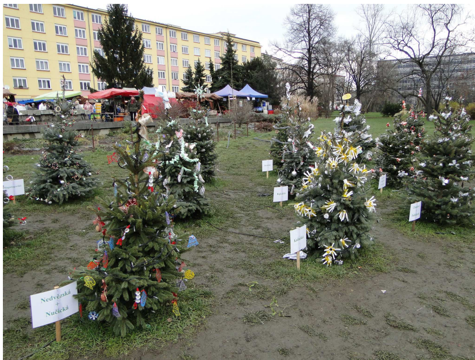
Letos byly vánoční stromečky na blátě