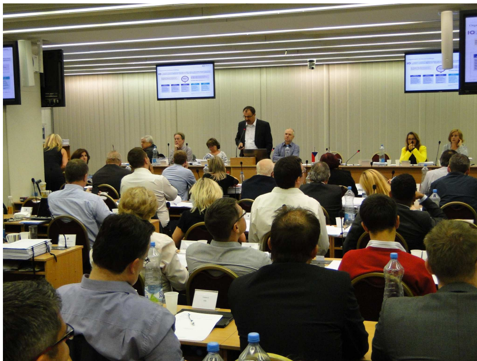
Zasedání Zastupitelstva MČ Praha 10 (je těsně před půlnocí)

Při tomto zasedání padl rekord a nekonečné jednání pokračovalo i v ranních hodinách 22. září. Nakonec ZMČ Praha 10 skončilo ve 2 hodiny a 10 minut.