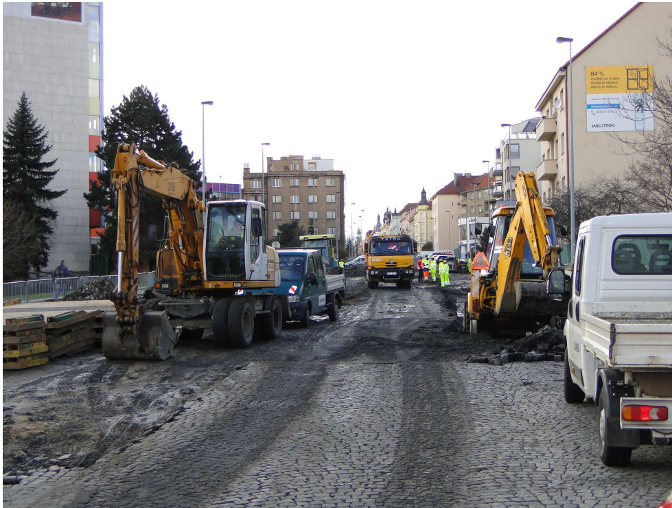
Kodaňská ulice se rekonstruovala