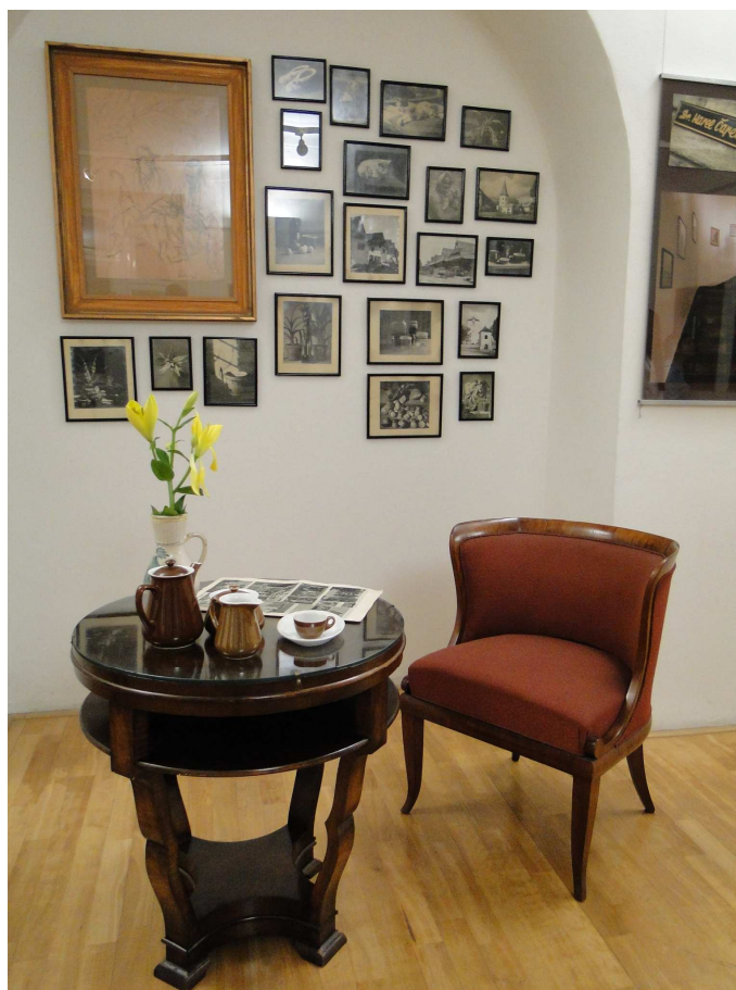
V Galerii Deset se uskutečnila výstava o Karlu Čapkovi

Radnice rovněž spolupracuje s Ministerstvem kultury ČR, Památkem národního písemnictví, Národním muzeem a Národním technickým muzeem jako odbornými garanty postupu prací s archiváliemi, zápisu sbírek a příprav vzniku muzea. Hlavním úkolem začátku roku 2016 bude dohoda s Ministerstvem kultury ČR a Památkem národního písemnictví ohledně zabalení a uskladnění archiválií po dobu rekonstrukce ve státních depozitářích.