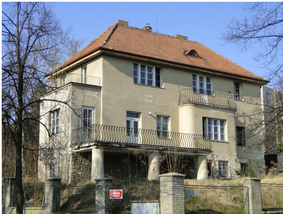
Vila ve Sluneční ulici

pracovat. Mynář nakonec v tomto roce nedostal bezpečnostní prověrku Národního bezpečnostního úřadu (NBÚ). Otázkou je, jestli k tomu přispěla i koupě této vily.