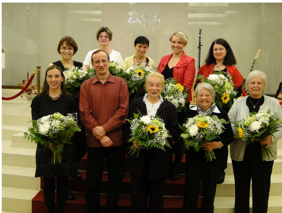
Dobrovolníci roku Prahy 10

Dobrovolníky z celkového počtu 11 nominovaných vybírala dne 18. listopadu 2015 jedenáctičlenná porota složená ze zástupců všech zastupitelských klubů ZMČ Praha 10, dvou zástupců ÚMČ Praha 10 a jednoho zástupce občanů. Nakonec bylo vybráno 10 dobrovolníků, kterým bylo předáno 2. 12. 2015 od 17:30 hodin v obřadní síni Vršovického zámku (Moskevská 120/21, Praha 10) ocenění „Dobrovolník roku Prahy 10“.