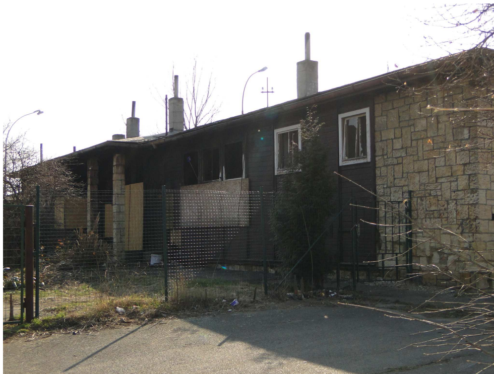
Obecná škola v roce 2015

Bezdomovci stáli asi také za požárem 12. srpna v podvečer, kdy hořela křoviska a tráva v těsném sousedství autobusové zastávky Na Homoli. S požárem bojovali hasiči pražského dopravního podniku. Do likvidace plamenů se zapojily posádky čtyř požárních vozů – z toho tří cisteren. Pro hasiče "z metra" to byl během dne třetí zásah, předtím vyjízděli kvůli poplachu požární signalizace a v důsledku zahoření zářivky. Požár u křižovatky ulic Černokostecká a U Stavoservisu mohl zavinit buď neopatrný kuřák, nebo bezdomovci, kteří v hájku mezi zastávkou a průmyslovým areálem přebývají.